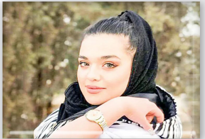
دادستان عمومی و انقلاب شیراز از صدور کیفرخواست برای یک متهم در پرونده ناپدید

وی با بیان اینکه در گردش رسیدگی، اتهام‌های وارده به یک مظنون ۳۵ ساله آشکار شناخته شد، افزود: کیفرخواست صادره با اتهام دعوت شبانه فرد ناپدید شده به بیرون از خانه بر پایه ماده ۵۱۳ قانون مجازات اسلامی