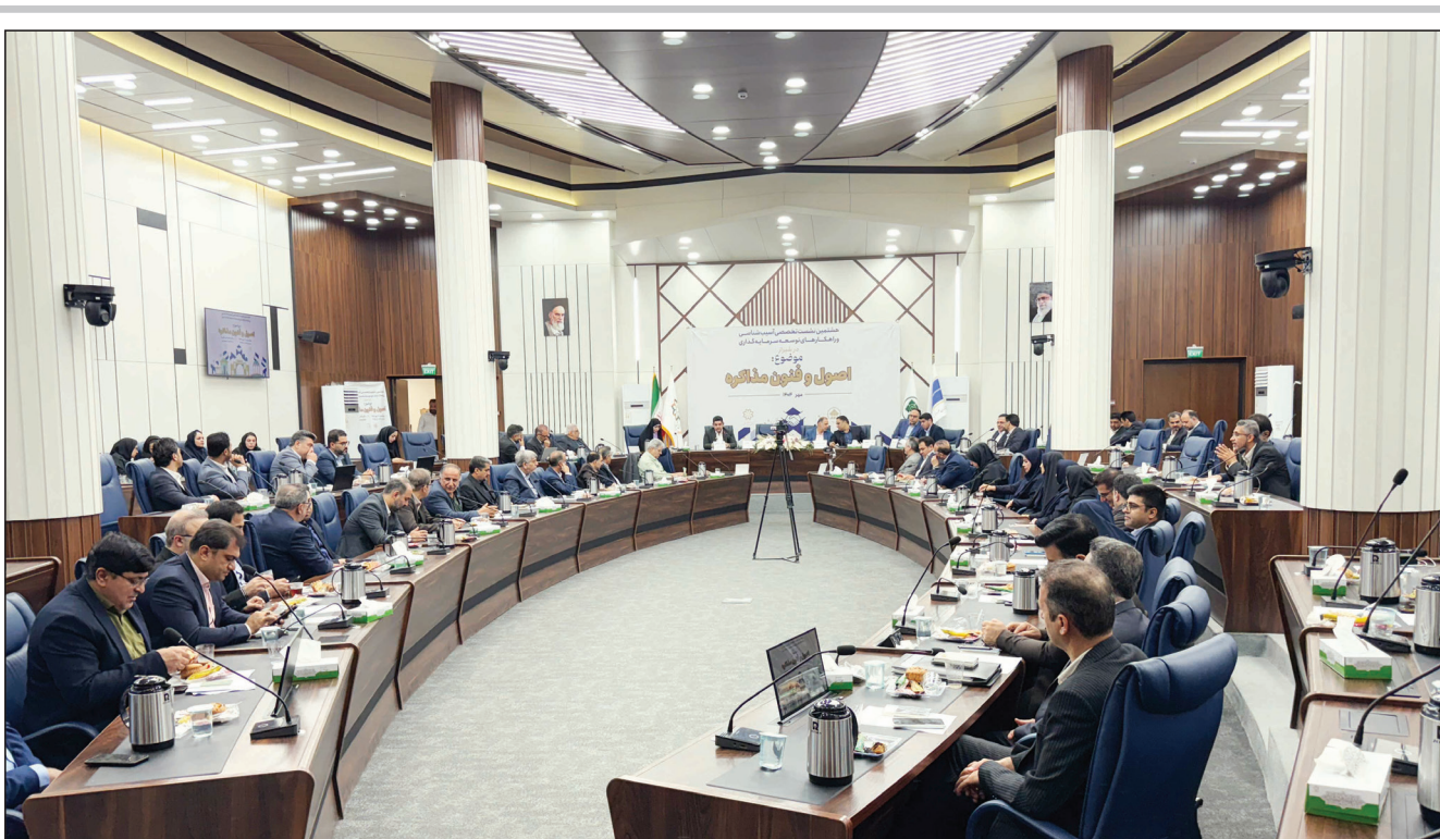
برگزاری نشست تخصصی با هدف ارتقای مهارت‌های ارتباطی مدیران شهری در جذب فعالان سرمایه‌گذار

وزیر میراث فرهنگی با اشاره به محدودیت‌های یگان حفاظتی این وزارتخانه، از همکاری موثر فراجا در مقابله با قاچاق عتیقه‌جات و حفاری‌های غیرمجاز خبر داد و گفت: در حوزه میراث فرهنگی؛ در مبارزه با قاچاق عتیقه‌جات و همچنین حفاری‌های غیرمجاز در بیش از ۲ هزار موردی که گزارش شد، فراجا به صورت جدی در کنار ما قرار داشت. سیدرضا صالحی امیری در گفت‌وگو با خبرنگار ایسنا، درباره همکاری وزارت میراث فرهنگی و فراجا گفت: ما ۱۵ هزار بنای ثبتی و ۲۲ هزار محوطه داریم که این‌ها نیاز به حفاظت و صیانت دارد. وزیر میراث فرهنگی، گردشگری و صنایع دستی خاطرنشان کرد: یگان حفاظتی ما به دلیل محدودیت قانونی امکان حمل سلاح را ندارند و در مواردی که با پدیده قاچاق و حفاری‌های غیرمجاز روبه‌رو می‌شویم، بیشترین همکاری را با ما فراجا دارد. وی تاکید کرد: باید از فرماندهی فراجا تشکر کنیم اخیراً هم گزارشی از عملکردشان در دولت دادند؛ انصافاً گزارش‌شان بسیار با ارزش و در جهت حفظ امنیت جامعه بود. یک کارنامه بسیار خوبی که ریاست محترم جمهور، معاون اول و اعضای دولت از فراجا تشکر کردند.