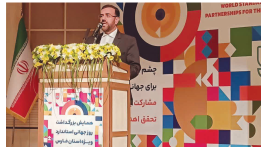
امیری استاندار فارس: