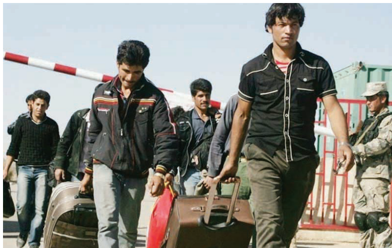
اتباع در مشاغل سخت و زیان‌آور ثبت کند و پس از انجام بررسی‌های لازم، مجوزهای مدیرکل اتباع و مهاجرین خارجی استانداری

فارس اظهار کرد: کارگران اتباع باید به صورت مجردي وارد کشور شوند و با توجه به اینکه مدت صدور روادید ۹ ماه است، پس از گذشت این مدت، آنها ملزم به ترک کشور خواهند بود. احمدی گفت: این افراد می‌توانند پس از بازگشت به کشورشان، در سال بعد، در صورت عدم وجود سابقه سوء به همان شیوه قبلی وارد کشور شوند. وی، از آن دسته از اتباع ساکن در فارس که دارای برگ سرشماری و فاقد مدرک قانونی هستند نیز خواست که در سریع‌ترین زمان ممکن به اردوگاه مراقبتی شیراز مراجعه کنند. مدیرکل اتباع و مهاجرین خارجی استانداری فارس، اظهار کرد: در صورت عدم اقدام، برخورد قانونی سختی در انتظار آنان خواهد بود.