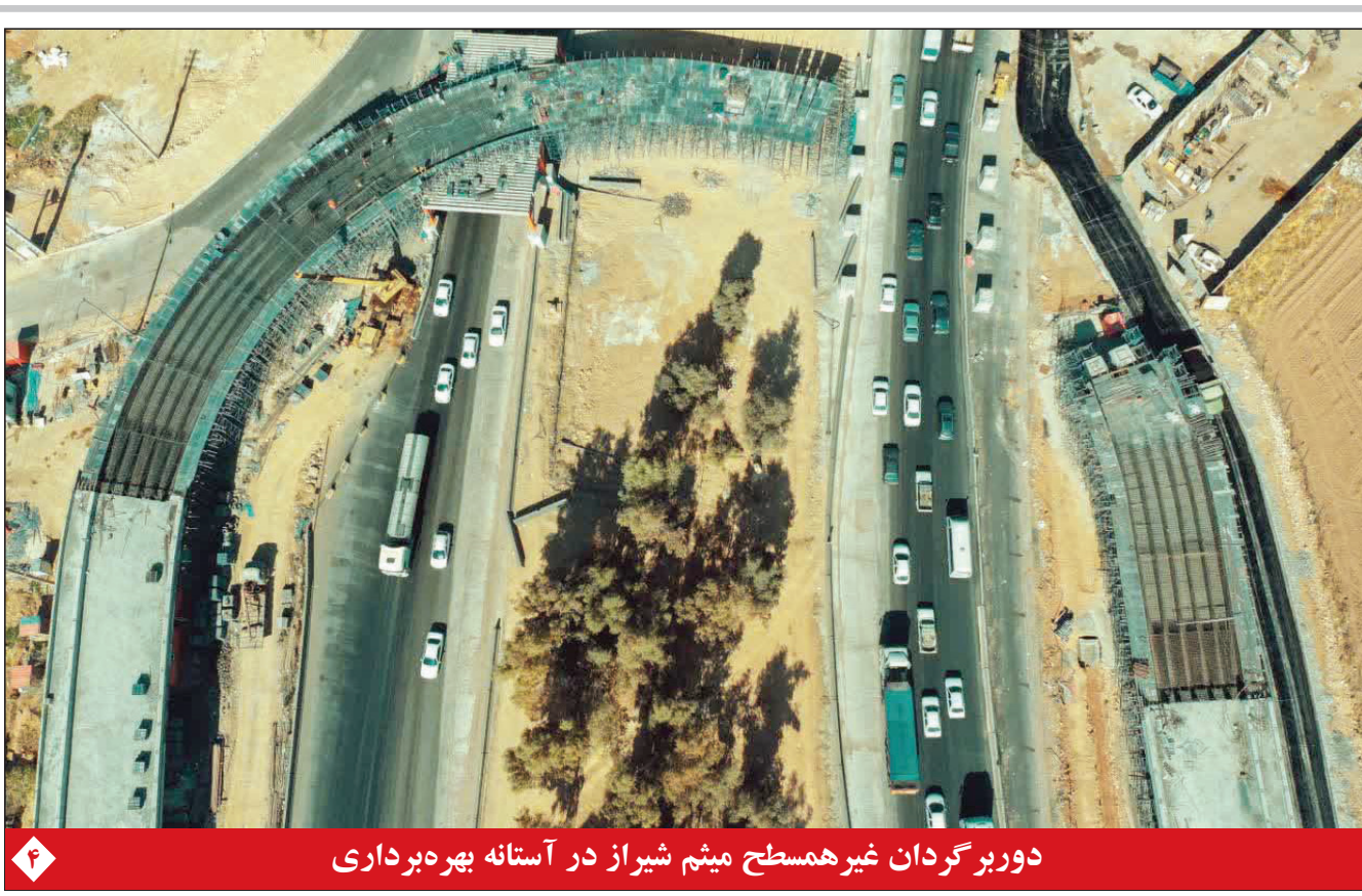
دوربرگردان غیرهمسطح میثم شیراز در آستانه بهره‌برداری