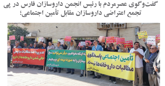
داروخانه‌های فارسی در آستانه بحران نقدینگی