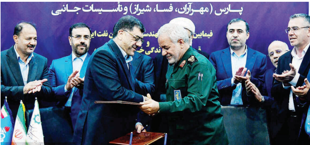
پارس (مهرآران، فسا، شیراز) و تأسیسات جانبی