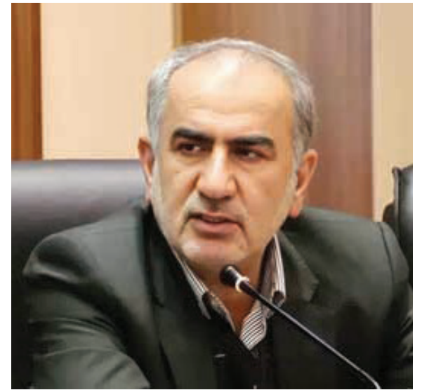
تجمع داروسازان مقابل تأمین اجتماعی و هشدار نسبت به توقف خدمات بیمه‌ای