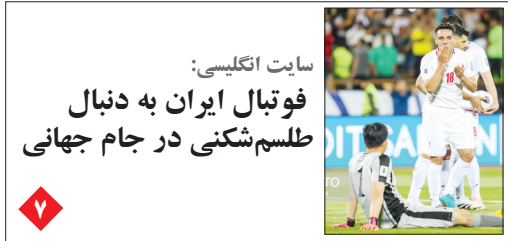
سایت انگلیسی: فوتبال ایران به دنبال طلمشکنی در جام جهانی