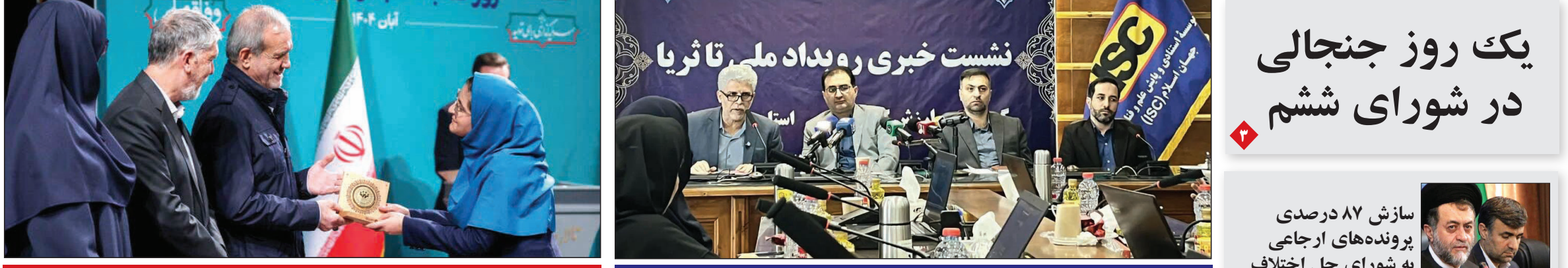
نشست خیری رویداد ملی «نا ثریا» با تمرکز بر توسعه گردشگری فارس