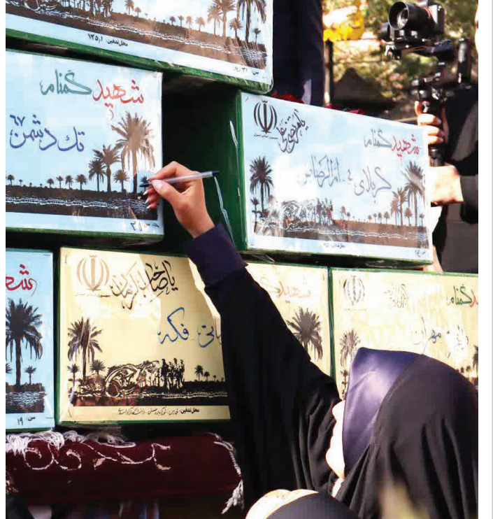
میزبانی شیراز از ۱۶ شهید گمنام

آغاز نشست علمی اجلاس بین‌المللی ایران‌شناسی با محوریت «حافظ و ایران‌شناسی»