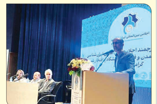
بخش نخست اجلاس بین‌المللی ایران‌شناسان با حضور ۵۰ ایران‌شناس از ۲۱ کشور دنیا صبح دیروز یکشنبه، ۲۶ آبان در تالار فجر دانشگاه شیراز برگزار شد که در آن ایران‌شناسان کشورهای مختلف مباحثی نظیر حافظ، روایتگر تاریخ پرفراز و نشیب ایرانیان، ایمازهای زندگی و نقش مساحت‌های نفسانی در نگاه حافظ، شعر، راهی برای آشکار حقیقت انسانی و... مطرح کردند.