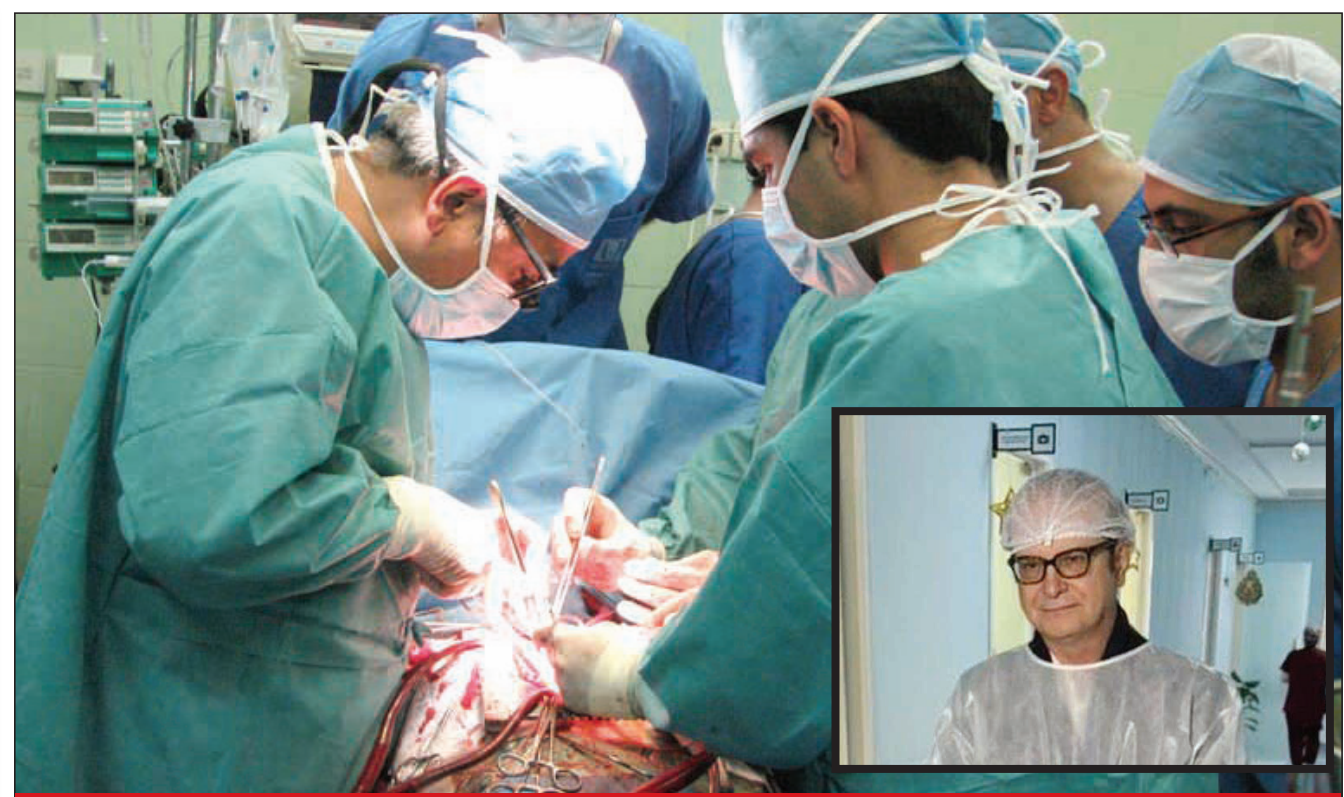
پزشکان شیرازی نخستین پیوند کبد در بخارا ازبکستان را با موفقیت انجام دادند