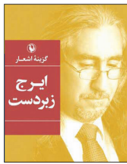
شعری که باران بی موقع نیست