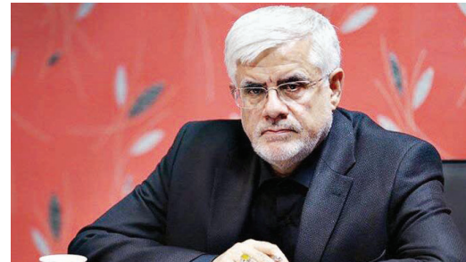
استغفای عارف رد شد

مشاور دفتر ریاست جمهوری از استغفای عارف و عدم پذیرش آن از سوی پزشکبان خبر داد.