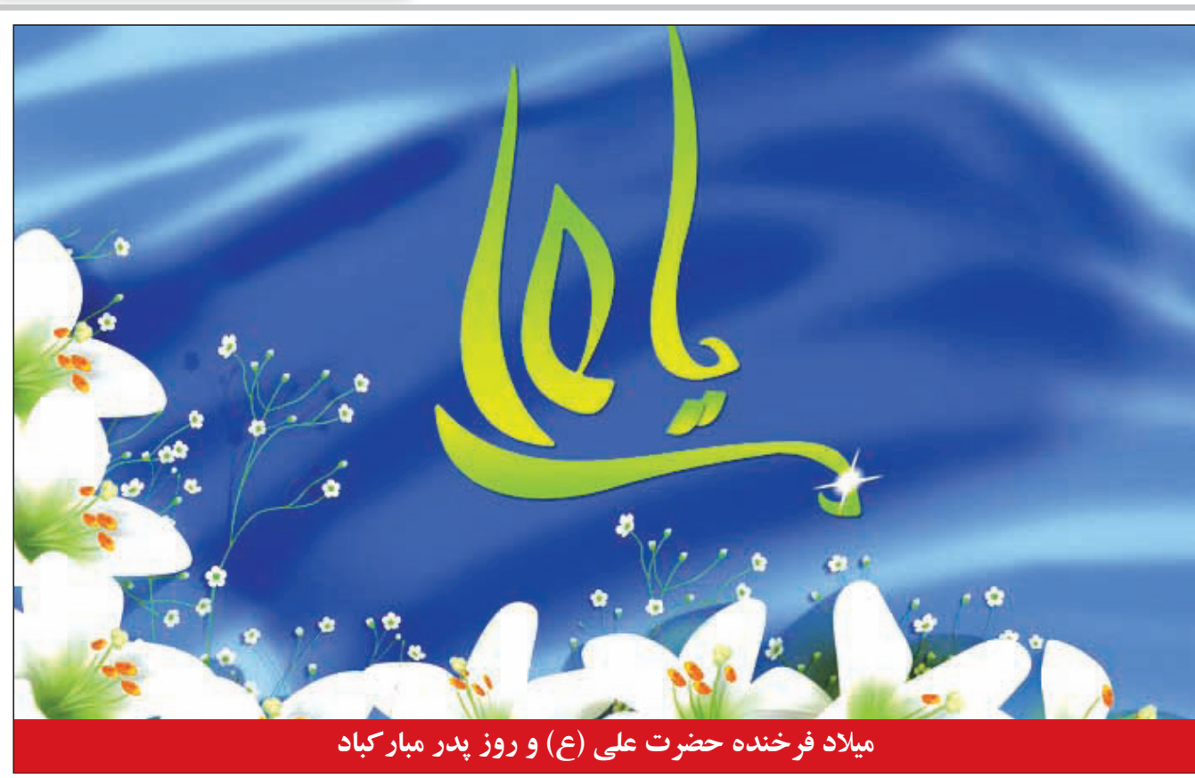
میلاد فرخنده حضرت علی (ع) و روز پدر مبارکباد

سخنگوی دولت از تصویب کلیات آیین نامه تضمین امنیت غذایی و معیشت مردم خبر داد. به گزارش ایسنا، فاطمه مهاجرانی در حاشیه جلسه امروز هیئت دولت در جمع خبرنگاران اظهار کرد: در جلسه امروز رئیس جمهوری همچنان بر شنیدن صدای مردم برای حل مشکلات تأکید کرد. وی افزود: همانطور که قبلاً گفتیم اعتراضات را به رسمیت می شناسیم، می دانیم فشار اقتصادی مردم را تحت آزار قرار داده است و همه تلاش خود را برای بهبود این وضعیت به کار می گیریم.