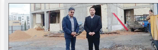
بازدید شهردار منطقه ۱۰ شیراز از روند اجرای مجموعه ورزشی شهید فرستیان

رئیس دادگستری فسا: کشته شدن یک نفر در جریان حمله به فرمانداری صحت ندارد