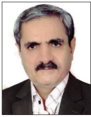
عناوین قدیمی شیراز اسماعیل عسلی