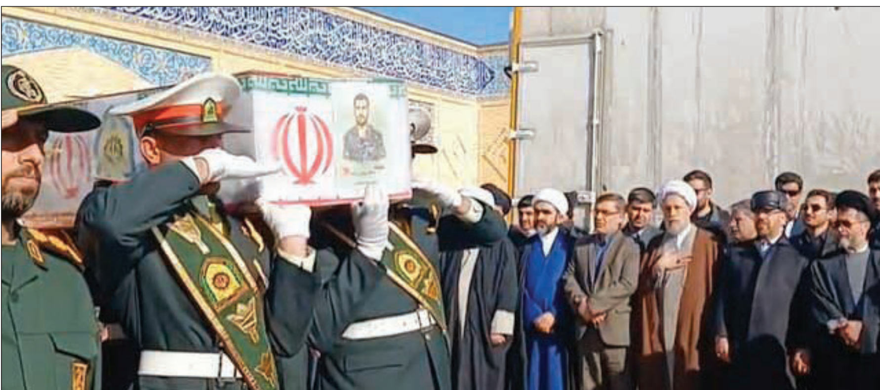
در مراسم تشییع شهدای امنیت مطرح شد: ملت ایران پیش از مسئولان به وظایف خود عمل می‌کنند