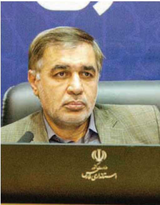
توزیع مرغ گرم و تخم مرغ در فارس به اندازه کافی و مطلوب است