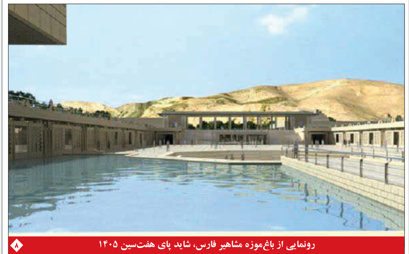
رونمایی از باغ‌موزه مشاهیر فارس، شاید پای هفت‌سین ۱۴۰۵