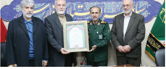
در دیدار مدیریت ارشد شهری شیراز با فرماندهی سپاه فجر فارس مطرح شد: