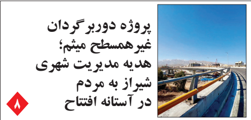
پروژه دوربرگردان غیر همسطح میثم؛ هدیه مدیریت شهری شیراز به مردم در آستانه افتتاح