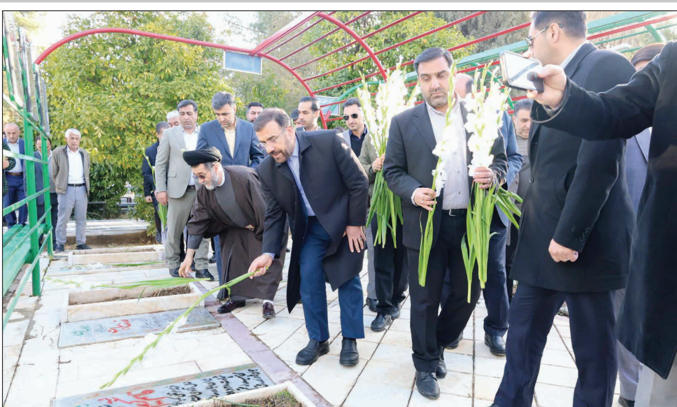
تجدید میثاق مدیران ارشد فارس با آرمان‌های شهدای انقلاب در نخستین روز دهه فجر