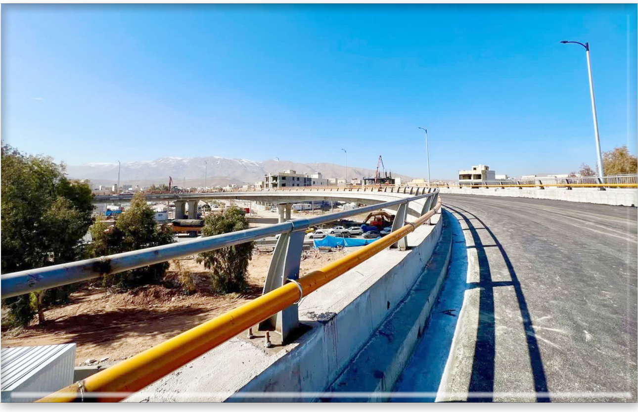
شهردار کلان‌شهر شیراز: مردم شیراز لایق بهترین‌ها هستند