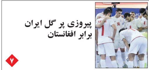
پیروزی پر گل ایران برابر افغانستان