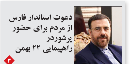
دعوت استاندار فارس از مردم برای حضور پرشور در راهپیمایی ۲۲ بهمن