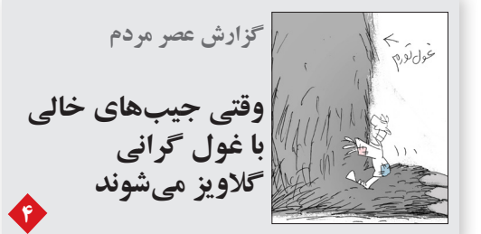
گزارش عصر مردم وقتی جیب‌های خالی با غول گرانی گلاویز می‌شوند