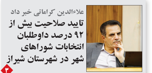
علاءالدین کرامتی خیر داد تأیید صلاحیت بیش از ۹۲ درصد داوطلبان انتخابات شوراهای شهر در شهرستان شیراز