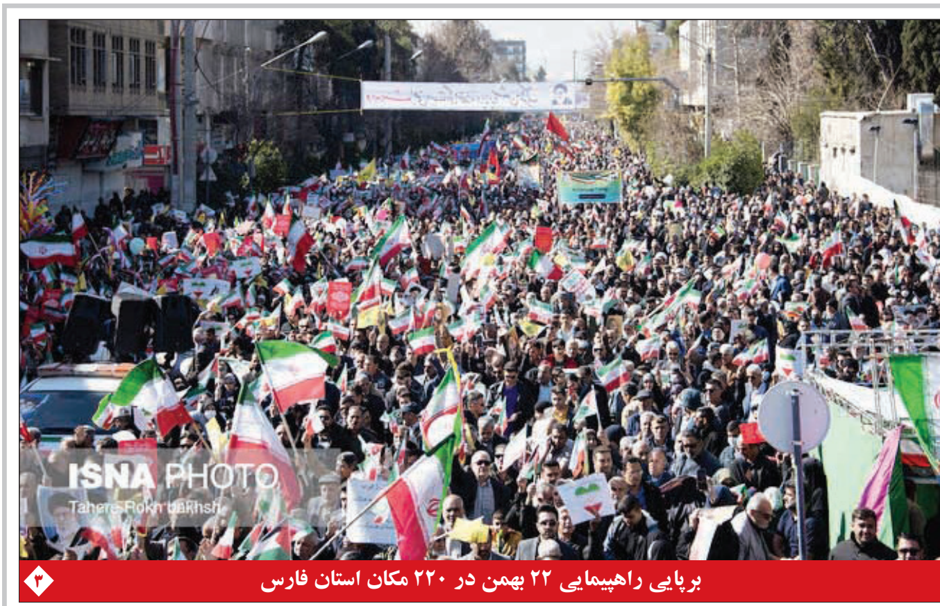
برپایی راهپیمایی ۲۲ بهمن در ۲۲۰ مکان استان فارس