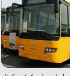
رئیس سازمان مدیریت حمل‌ونقل مسافر شهرداری شیراز از ارائه خدمات رایگان حمل‌ونقل با ۲۷۰ دستگاه اتوبوس برای جابه‌جایی شهروندان و مشتاقان حضور در راهپیمایی روز جهانی قدس خبر داد.

شهرداری شیراز، اظهار داشت: تعداد ۲۷۰ دستگاه اتوبوس در روز جهانی قدس از ساعت ۹ صبح از کیله‌ها امکن و مسیرهای سطح شهر از جمله مساجد، مدارس و حوزه‌های بسیج تا مسیرهای راهپیمایی، به شرکت‌کنندگان در این مراسم خدمات رایگان ارائه کردند.