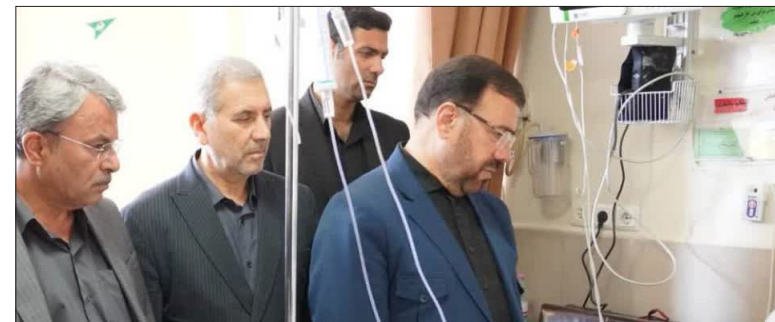
وی در حاشیه این بازدید با تأکید بر آمادگی کامل مراکز بهداشتی درمانی و بیمارستان های فارس