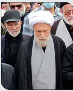
نماینده ولی فقیه در استان فارس با اشاره به نخستین پیام رهبر معظم انقلاب، تأکید کرد که خواست عمومی مردم امروز ایستادگی محکم در برابر دشمن تا شیمیایی کامل است.

این صلابت و ایستادگی، بار دیگر نشان داد که مردم شیراز و فارس، پرورتر از همیشه در حمایت از آرمان فلسطین و جبهه مقاومت ایستاده‌اند و هیچ تهدید و فشاری نمی‌تواند آنان را از این مسیر منحرف کند.