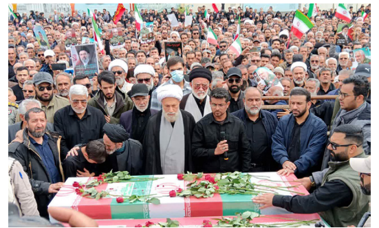
تشیع ۸ شهید جنگ رمضان در شیراز