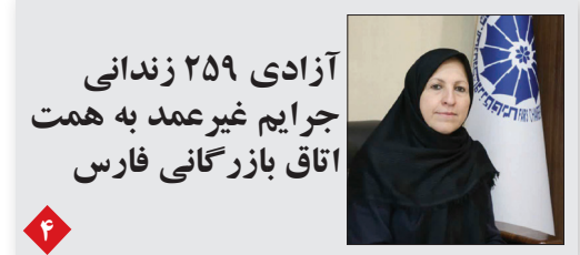
آزادی ۲۵۹ زندانی جرایم غیر عمد به همت اتاق بازرگانی فارس