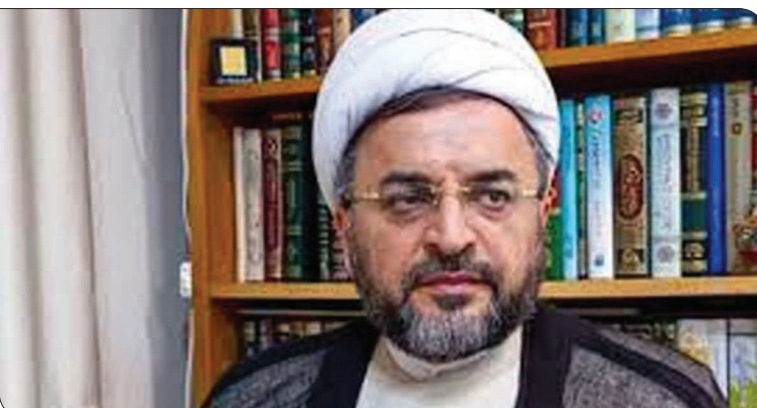
هادی سروش: خون، محترم است مگر این که خلاف آن ثابت شود

استاد فقه و فلسفه حوزه علمیه قم با بیان اینکه در فقه حفظ خون، چه خون بی گناه و چه خون فرد متهم که می خواهد ریخته شود، از اهمیت بالایی برخوردار است، گفت: در مواردی که شبهه ایجاد شود، قطعاً باید «دست نگه داشت» و از امکان صدور یا اجرای حکم از نظر فقهی صرف نظر کرد و اگر حکم فقهی هم در شرایط فعلی مصداق مصلحت