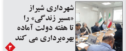
شهرداری شیراز «مسیر زندگی» را تا هفته دولت آماده بهره برداری می کند