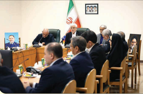
عارف: انسجام ملی، پروژه دوقطبی سازی دشمن را شکست داد

معاون اول رئیس جمهور با اشاره به تحولات اخیر و نقش تعیین کننده انسجام ملی گفت: دشمن در دی ماه با هدف ایجاد بی ثباتی و دوقطبی سازی جامعه وارد میدان شد، اما با رویکرد وحدت آفرین نظام، این پروژه به طور کامل ناکام ماند. به گزارش ایسنا، هیأت دولت به ریاست محمدرضا عارف، معاون اول رئیس جمهور، تشکیل جلسه داد و در ابتدای این نشست، وی به تبیین شرایط کشور و اولویت های دولت پرداخت. معاون اول رئیس جمهور با اشاره به تحولات اخیر و نقش تعیین کننده انسجام ملی گفت: دشمن در دی ماه با هدف ایجاد بی ثباتی و دوقطبی سازی جامعه وارد میدان شد، اما با رویکرد وحدت آفرین نظام، این پروژه به طور کامل ناکام ماند. وی افزود: در همان مقطع، برای نخستین بار کشته شدگان حادثه دی ماه از سوی دولت شهید تلقی شدند و همین نگاه، نقش مهمی در تقویت همبستگی اجتماعی و خنثی سازی سناریوی دشمن داشت؛ رویکردی که در جنگ رمضان به اوج رسید و انسجام ملی را تقویت کرد. عارف با تأکید بر نقش مردم تصریح کرد: مردم طی بیش از ۶۰ شب حضور مستمر در صحنه، پای کشور و آرمان های خود ایستادند و هر شب این حضور پرشورتر شد. این مردم صحنه گردانان اصلی جنگ رمضان هستند و دولت افتخار می کند خدمتگزار آنان باشد. وی با اشاره به رشادت نیروهای مسلح کشور در برابر حملات دشمن خاطرنشان کرد: این مقاومت، معادلات جهانی را تغییر داد و نشان داد دوران یک جانبه گرایی، تحریم و نگاه قیم یابانه رو به پایان است.