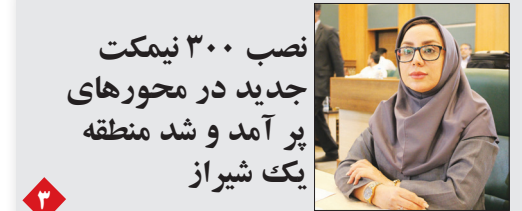
نصب ۳۰۰ نیمکت جدید در محورهای پر آمد و شد منطقه یک شیراز