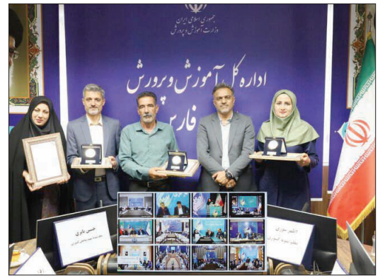
تجلیل از ۴ معلم نمونه کشوری فارس در ارتباط برخط با وزیر آموزش و پرورش