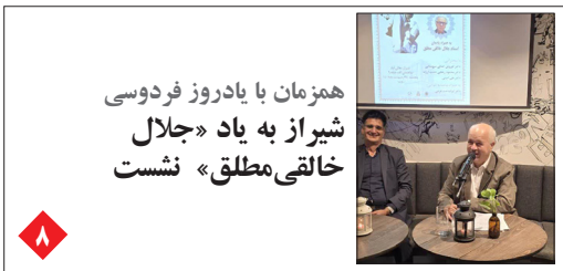
همزمان با یادروز فردوسی شیراز به یاد «جلال خالقی مطلق» نشست