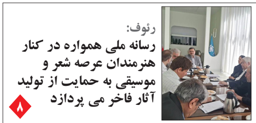
رئوف: رسانه ملی همواره در کنار هنرمندان عرصه شعر و موسیقی به حمایت از تولید آثار فاخر می پردازد