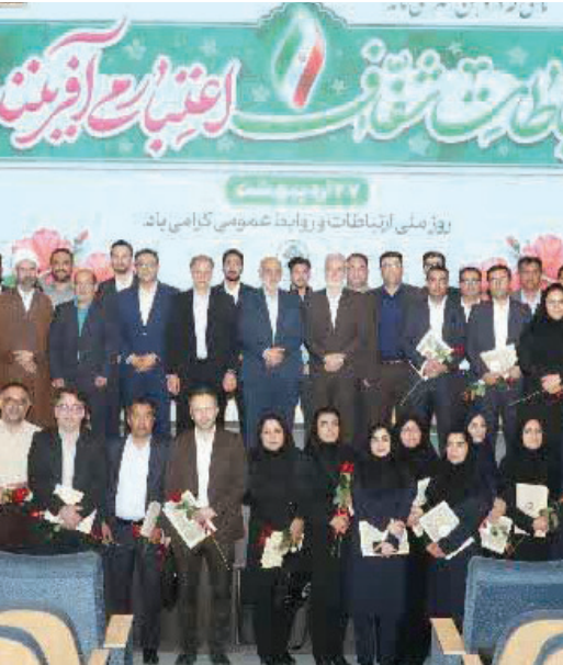
روز ملی ارتباطات و روابط عمومی گرامی باد

به گفته رئیس شورای اسلامی شهر شیراز، آینده‌نگری در مدیریت شهری و تقویت همدلی میان بخش‌های مختلف می‌تواند زمینه ارتقای جایگاه شیراز در سطح ملی و بین‌المللی را فراهم کند.