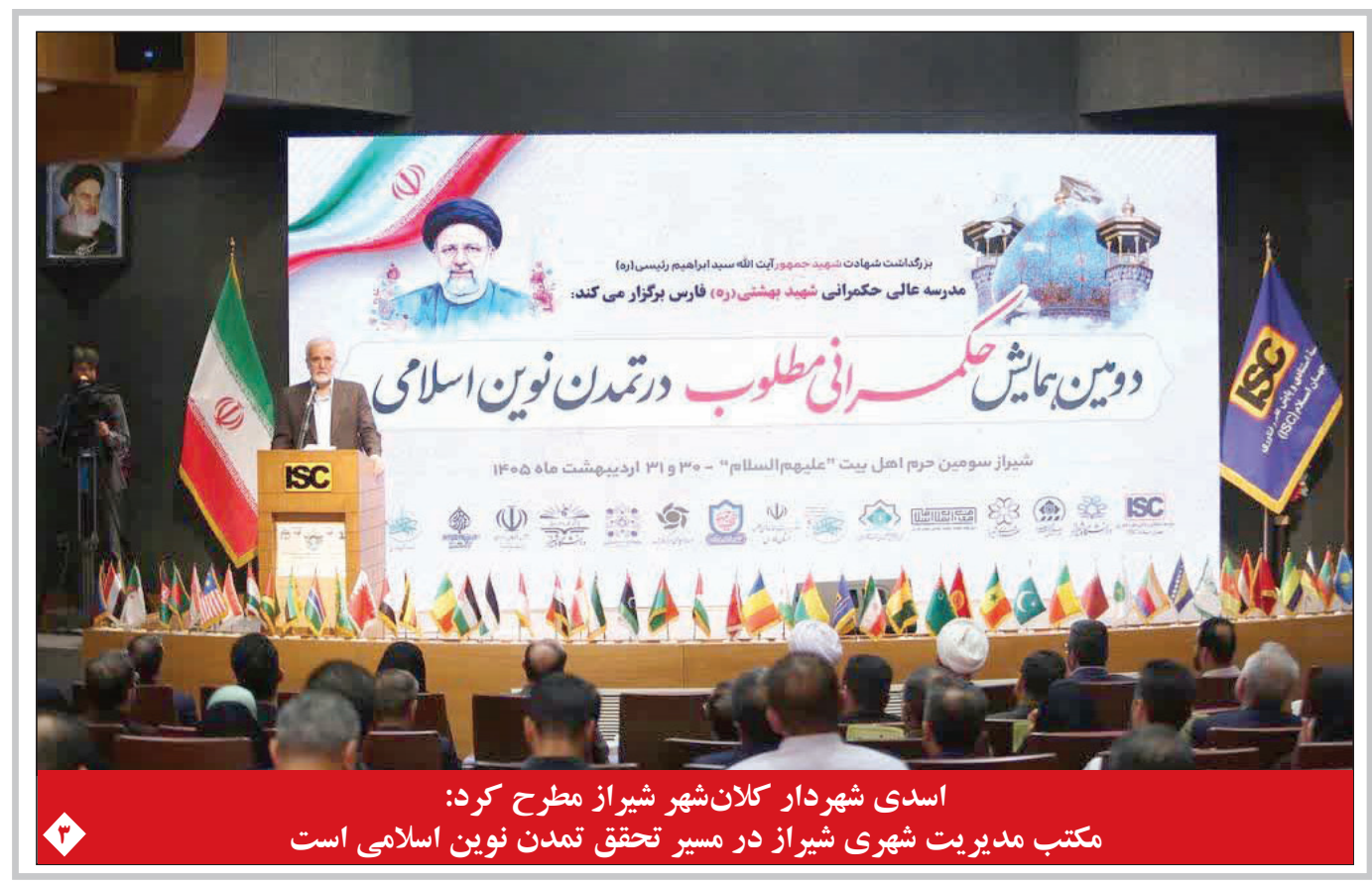
اسدی شهردار کلان شهر شیراز مطرح کرد: مکتب مدیریت شهری شیراز در مسیر تحقق تمدن نوین اسلامی است