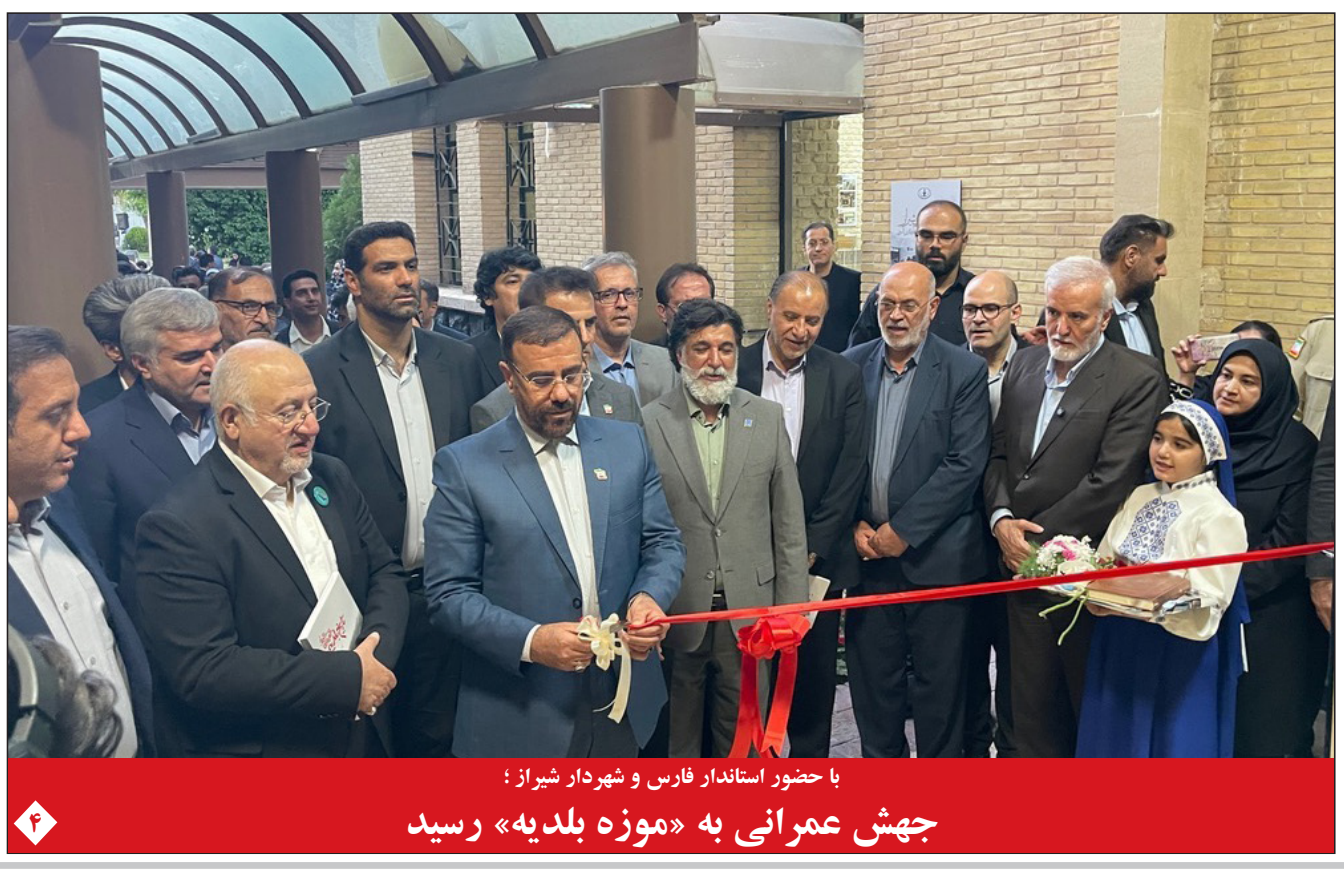
با حضور استاندار فارس و شهردار شیراز: جهش عمرانی به «موزه بلدیة» رسید

استقبال اروپایی‌ها از توافق احتمالی ایران و آمریکا افزایش ۷۸ هزار واحدی شاخص کل بورس هیچ مسئولی حق اظهار نظر شخصی درباره بنزین ندارد