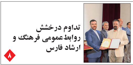
تداوم درخشش روابط عمومی فرهنگ و ارشاد فارس