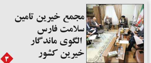
مجمع خیرین تامین سلامت فارس الگوی ماندگار خیرین کشور