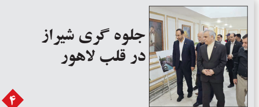
جلوه گری شیراز در قلب لاهور