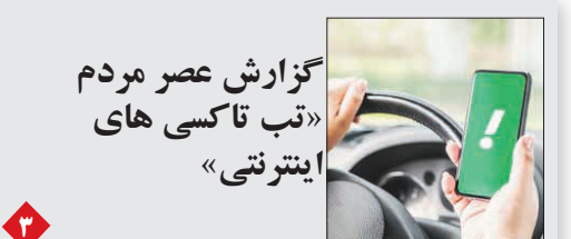
گزارش عصر مردم «تب تاکی های اینترنتی»