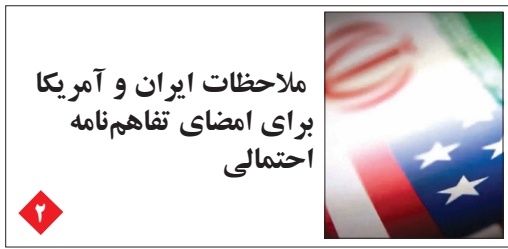
ملاحظات ایران و آمریکا برای امضای تفاهم نامه احتمالی