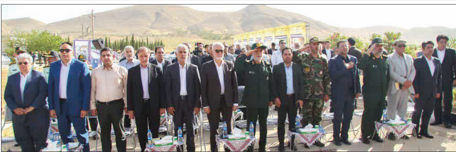
آغاز عملیات ساخت معراج شهدا در هشتاد و یکمین گام از جهش عمرانی شیراز

از ریزنی درباره پایان جنگ تا پیگیری رفع تحریمها در دستور کار است