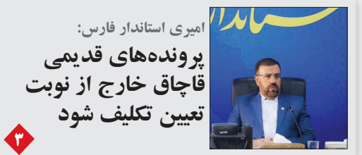
امیری استاندار فارس: پرونده‌های قدیمی قاچاق خارج از نوبت تعیین تکلیف شود