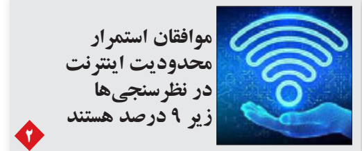
موافقان استمرار محدودیت اینترنت در نظر سنجی‌ها زیر ۹ درصد هستند