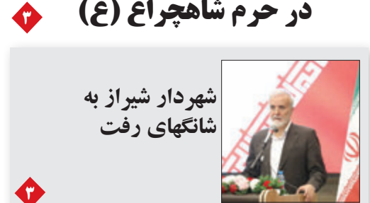
شهردار شیراز به شاکهای رفت