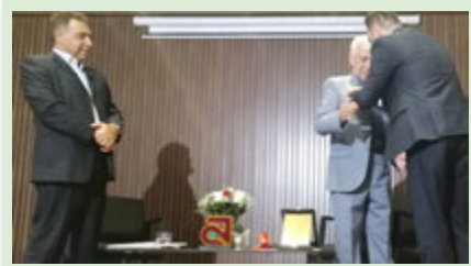
کتاب‌آرایی؛ از دفتر کار ۲۰ متری تا صحنه‌های جهانی

گزارش حضور مردم با تکانی به خروجی جلسه ۶۰۵ کار گروه تسهیل و رفع موانع تولید در خرم‌مید؛