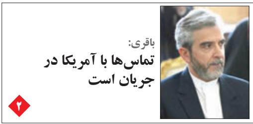
باقری: تماس‌ها با آمریکا در جریان است