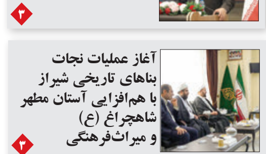
آغاز عملیات نجات بناهای تاریخی شیراز با هم‌افزایی آستان مطهر شاهچراغ (ع) و میراث فرهنگی