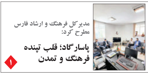
مدیر کل فرهنگ و ارشاد فارس مطرح کرد: پاسارگاد؛ قلب تپنده فرهنگ و تمدن