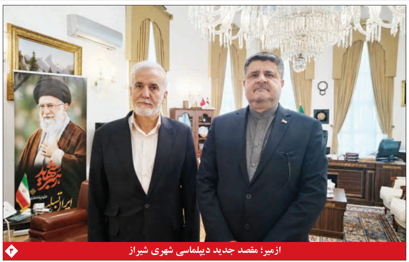
از میر؛ مقصد جدید دیپلماسی شهری شیراز