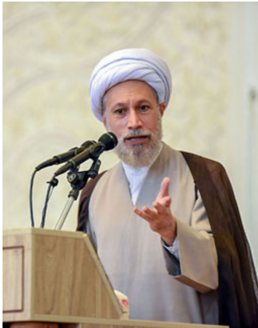
اصل ولایت فقیه برگرفته از غدیر است آیت‌الله دژکام تاکید کرد: اصل ولایت فقیه بر پایه اصلی

وی گفت: در حال حاضر ۳۵ میلیون نفر جانفدا ثبت شده و همه آماده هستند در حوزه بهره‌وری به کار گرفته شوند که قطعاً نتایج مثبتی برای کشور در پی خواهد داشت.