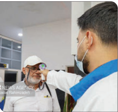
در صورت مشاهده موارد مشکوک به بیماری‌های

معاون بهداشت دانشگاه علوم پزشکی شیراز همچنین از تلاش و همکاری کارشناسان بهداشت، کارکنان پایگاه مراقبت مرزی و سایر دستگاه‌های همکار قدردانی کرد و گفت: حفظ سلامت زائران و پیشگیری از انتقال بیماری‌ها، از اولویت‌های اصلی نظام سلامت است و تمامی تمهیدات لازم در این زمینه پیش‌بینی شده است.