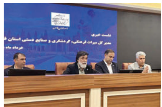
مدیر کل میراث فرهنگی استان اعلام کرد: