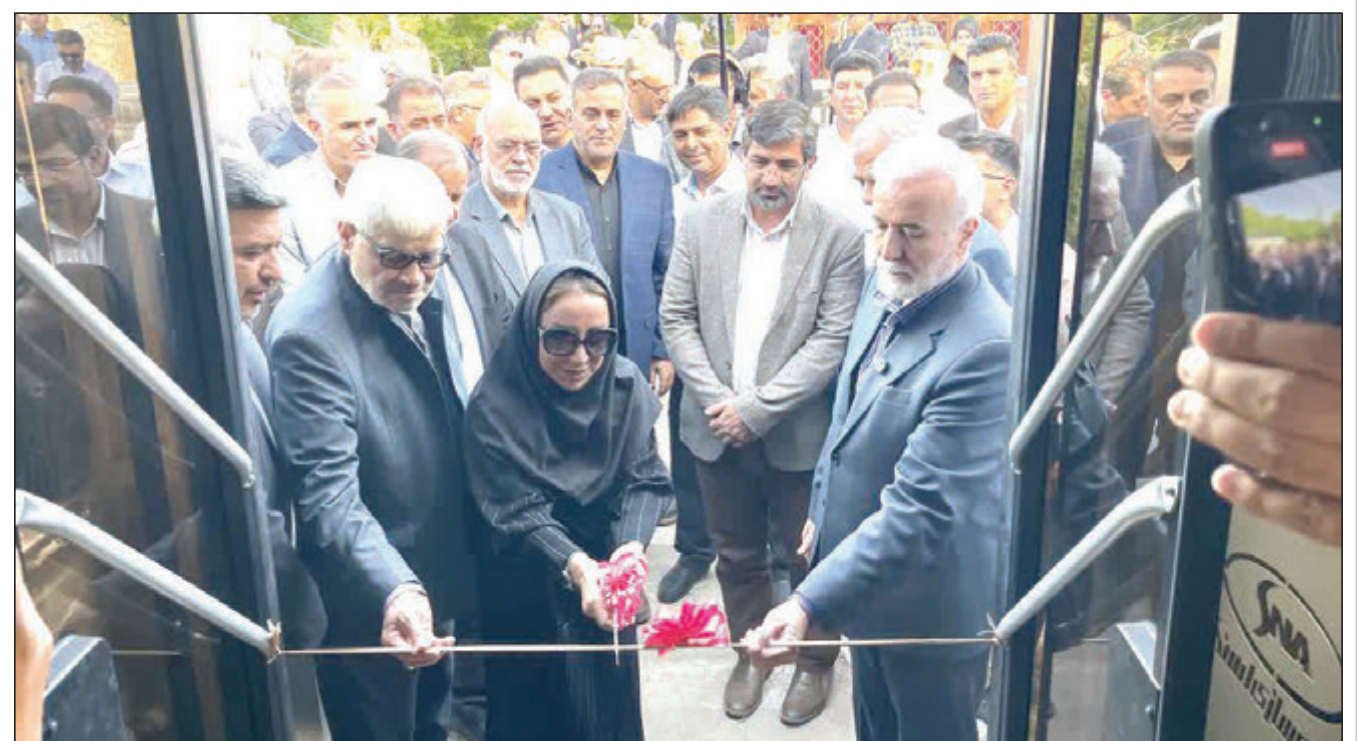
گزارش خبری - تحلیلی عصر مردم از هشاد و دومین مرحله جهش عمرانی کلان‌شهر شیراز؛ توسعه بر مدار تاب‌آوری؛ ۹۲۰ میلیارد تومان اعتبار برای قلب شهر و نوسازی ناوگان