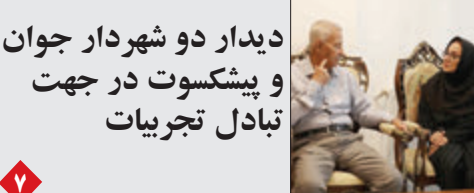
دیدار دو شهردار جوان و پیشکوت در جهت تبادل تجربیات