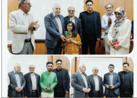
گزارش عصر مردم از آیین تقدیر از برگزیدگان فراخوان 'داستانک یا دلنوشته'!