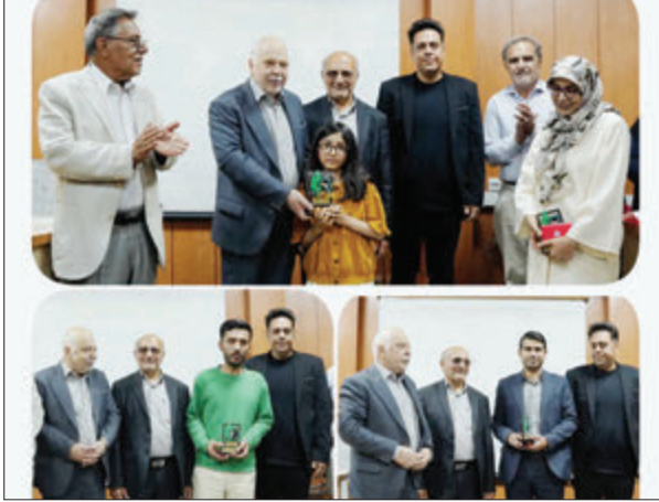
دوباره آشنایان با این میراث فراهم شود.

تلاشی برای پیوند دوباره شهروندان با میراث ادبی دستگیر هدف از برگزاری این فراخوان را ایجاد پیوندی دوباره میان شهروندان و جنبه‌های ادب فارسی دانست و گفت: در سال‌های اخیر ارتباط نسل جوان با این متون ارزشمند کمتر شده و لازم است با برنامه‌های فرهنگی، زمینه آشنایی