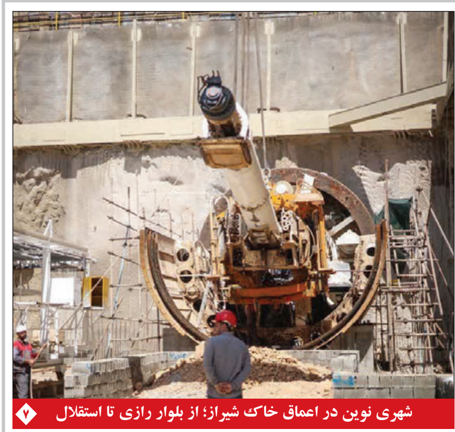
شهری نوین در اعماق خاک شیراز: از بلوار رازی تا استقلال