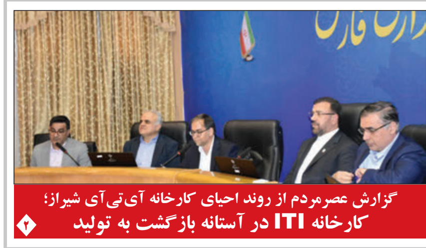
گزارش عصر مردم از روند احیای کارخانه آی تی آی شیراز: کارخانه ITI در آستانه بازگشت به تولید

تاجگردون مدیرکل محیط زیست فارس عنوان کرد: شیراز شانس آورده که صنعتی نیست! وقتی انسان‌ها به حیوانات حمله می‌کنند! ۱۹ نقطه آلوده در مسیر ۵۲ کیلومتری انسان، متهم ردیف اول خشکی تالابها