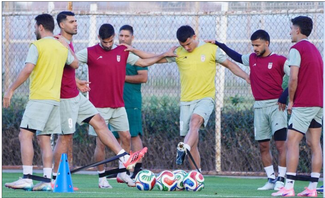
مقابل بلژیک و مصر هم تکرار شود. کاروان تیم ملی فوتبال ایران دیروز (شنبه) عازم مکزیک شد و تا ساعاتی دیگر به تیخوانا، محل برگزاری کمپ تیم ملی می‌رسد.

تیم ملی فوتبال ایران در شرایطی در جام جهانی ۲۰۲۶ به میدان خواهد رفت که با کارشکنی آمریکا، تنها یک روز قبل از بازی با نیوزلند اجازه ورود به آمریکا و فرصت یک جلسه تمرینی خواهد داشت.