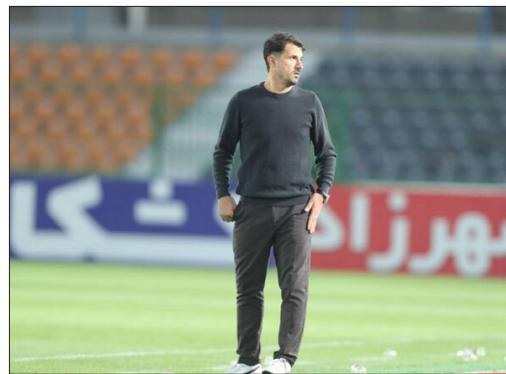
حدادی‌فر انتخاب کنیم تا تیم با قدرت در رقابت‌های مقدماتی جام ملت‌های زیر ۲۰ سال شرکت کند. تیم ما قرار است از ۳ تا ۱۵ شهریور، در گروه C انتخابی جام ملت‌ها که با حضور ایران، ویتنام و کره شمالی در ویتنام شرکت کند