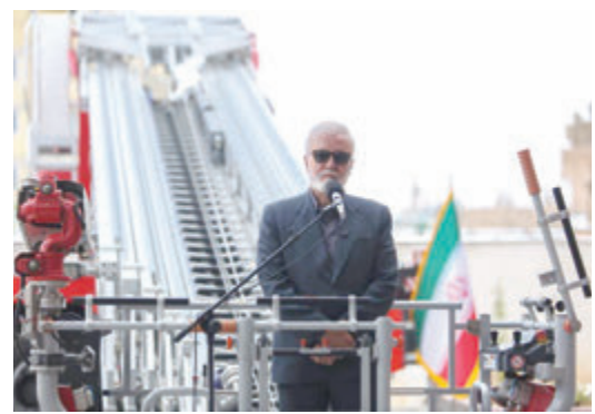
جهش زیرساخت‌های ایمنی در شیراز؛ از ساخت همزمان ۱۰ ایستگاه آتش‌نشانی تا تهیه پهپادهای مهار آتش سوزی

حمله دشمن به ۱۲ نقطه در کشور سپاه: تجاوز دشمن به صنایع پتروشیمی پاسخ داده شد قالیباغ: معادله آتش بس روی کاغذ و نقض مکرر آن در میدان را برهم زدیم