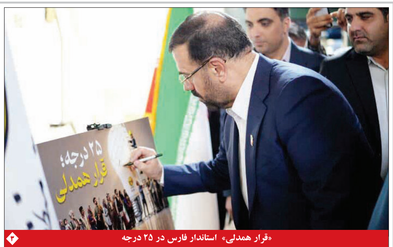
«قرار همدلی» استاندار فارس در ۲۵ درجه

در نشست خبری شرکت توزیع نیروی برق فارس مطرح شد: اگر درست مصرف نکنید، برق می‌رود خسارت ۲۱۰۰ میلیارد تومانی جنگ به شبکه برق فارس تاکنون برنامه خاموشی اعلام نشده است نیروگاه‌های خورشیدی کالای لوکس نیستند سه بسته تشویقی برای مشترکین خانگی؛ کشاورزان و صنایع