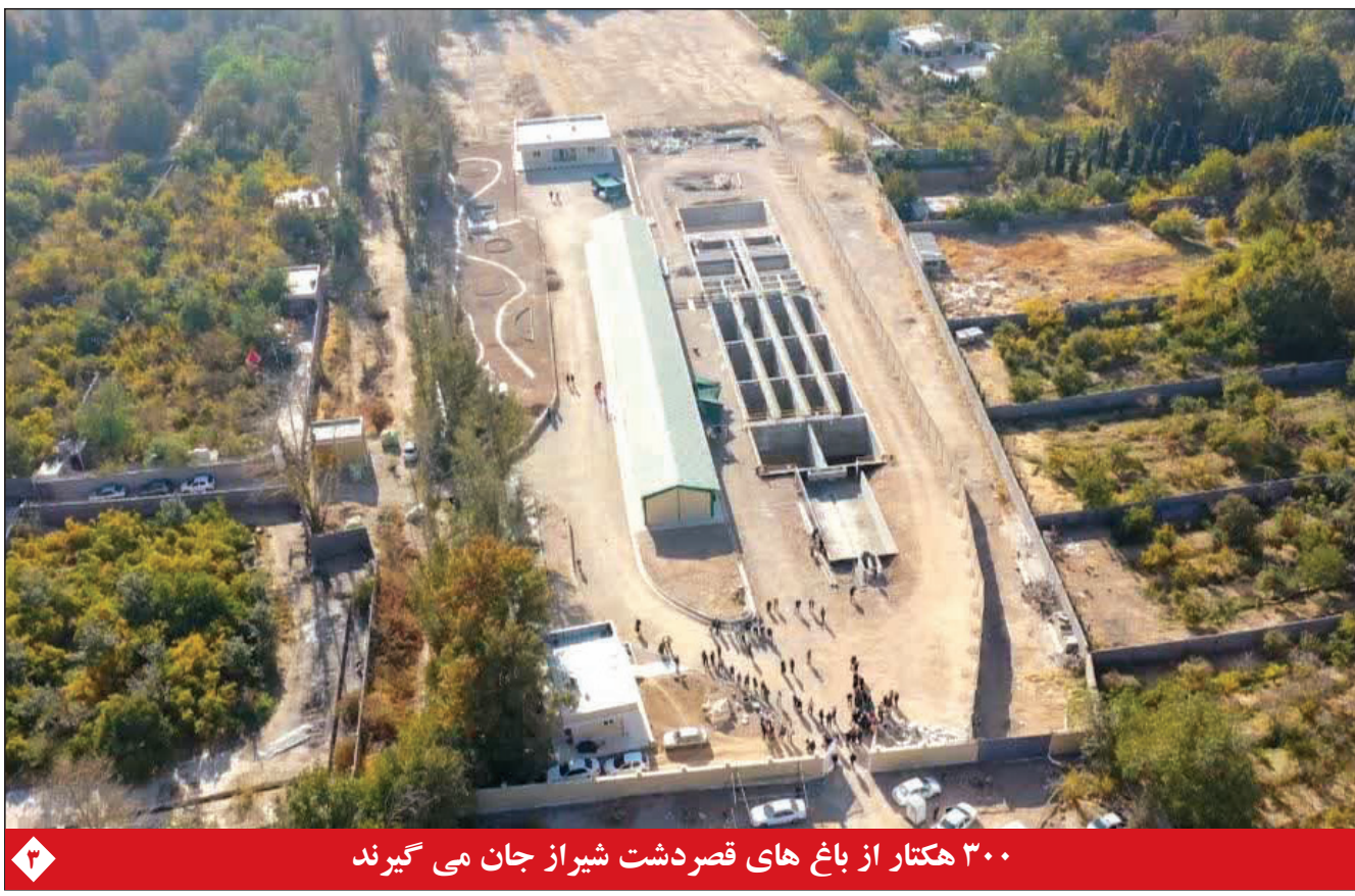
۳۰۰ هکتار از باغ های قصر دشت شیراز جان می گیرند