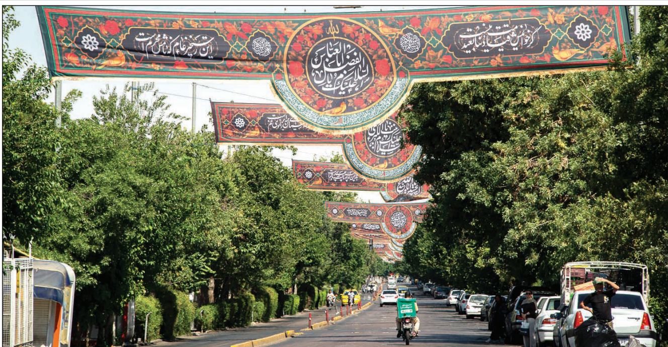
رخت عزا بر تن شهر

چوبینی رئیس سازمان فرهنگی، اجتماعی و ورزشی شهرداری شیراز: ایستادگی مردم در برابر فشارها و حفظ روحیه مقاومت، ریشه در فرهنگ عاشورا دارد