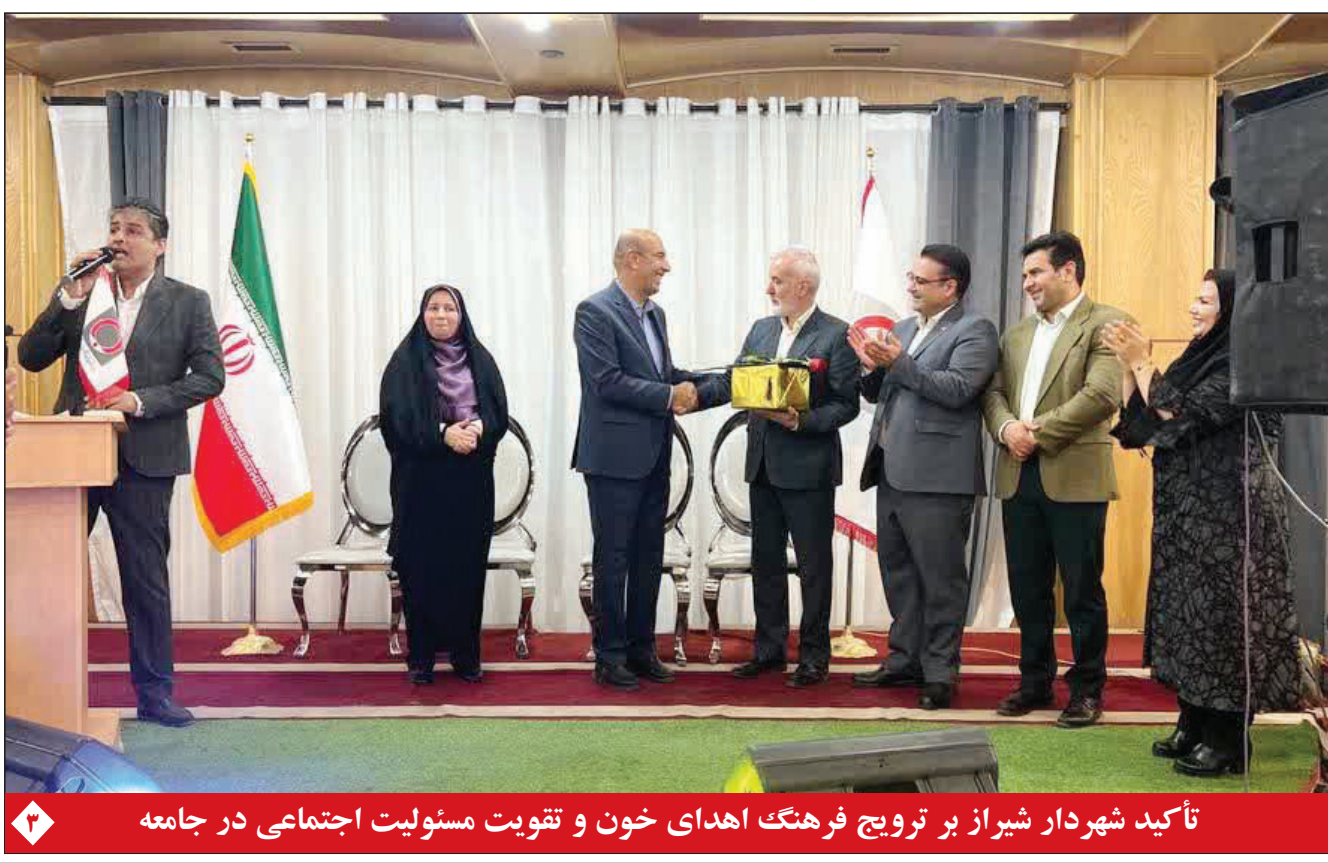
تأکید شهردار شیراز بر ترویج فرهنگ اهدای خون و تقویت مسئولیت اجتماعی در جامعه

نیس‌جمهور گفت: تفاهم‌نامه جنگ میان ایران و آمریکا با هماهنگی صورت گرفته، قرار است روز جمعه به امضا برسد. به گزارش خبرنگار سیاسی ایرنا، مسعود پزشکیان روز دوشنبه در حاشیه در همایش سراسری «حکمرانی هم‌افزا» با حضور استانداران، فرمانداران، شهرداران و بخشداران کشور که در وزارت کشور برگزار شد درباره اقدامات صورت گرفته روز گذشته برای امضای تفاهم‌نامه جنگ میان ایران و آمریکا، گفت: با هماهنگی صورت گرفته، مصوب شد روز جمعه «این روند» را امضا کنند. رئیس‌جمهور با تأکید بر اینکه از قبل اختیارات به استانداران تفویض شده است، گفت: مدیریت صحیح شرایط جنگ به خاطر تفویض اختیاراتی بود که به استانداران صورت گرفت. وی با طرح این پرسش که چرا نسبت به اداره کشور (در شرایط جنگ) اعتراض نشد؟ اظهار داشت: این مهم با اقدامات و کارهایی که استانداران و فرمانداران انجام دادند، محقق شد. همه کمک کردند و در حالی که دشمن تصور می‌کرد کشور در زمان جنگ از هم خواهد پاشید و بازار، ادارات و سیستم بر هم خواهد ریخت، شرایط به خوبی مدیریت شد و این اتفاق نیفتاد.