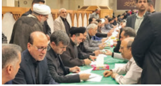
رجایی نسب رییس کل دادگستری خبر داد شناسایی ۲۴ کانون فسادزا در فارس