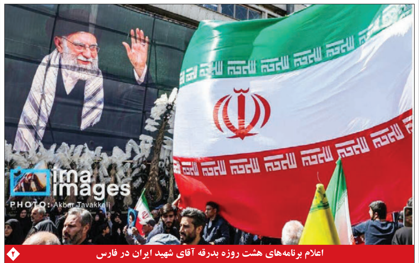
اعلام برنامه‌های هشت روزه بدرقه آقای شهید ایران در فارس