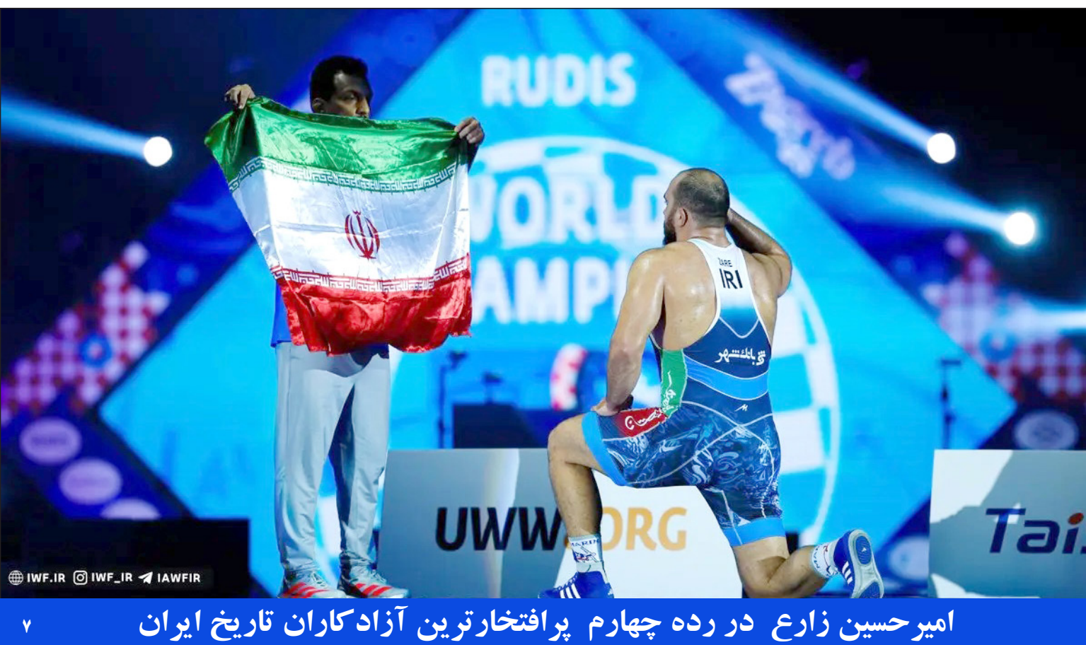
امیر حسین زارع در رده چهارم پرافتخارترین آزادکاران تاریخ ایران