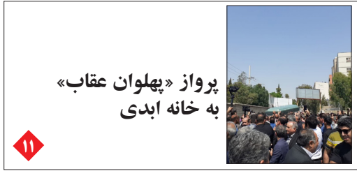
پرواز «پهلوان عقاب» به خانه ابدی