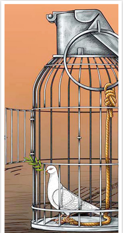
طرح: عصر مردم

در کل «غمین» از اینک، می بینمت که دانم نومید و دلشکسته، «تالی» دلم گرفته