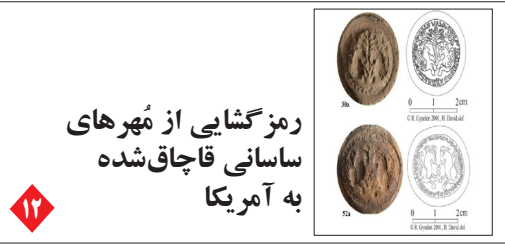
رزم گشایی از مهرهای ساسانی قاچاق شده به آمریکا