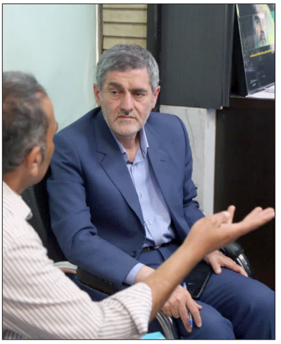
طاہری مدیر پخش فرآورده‌های نفتی اعلام کرد: علت محدودیت عرضه بنزین سوپر در فارس