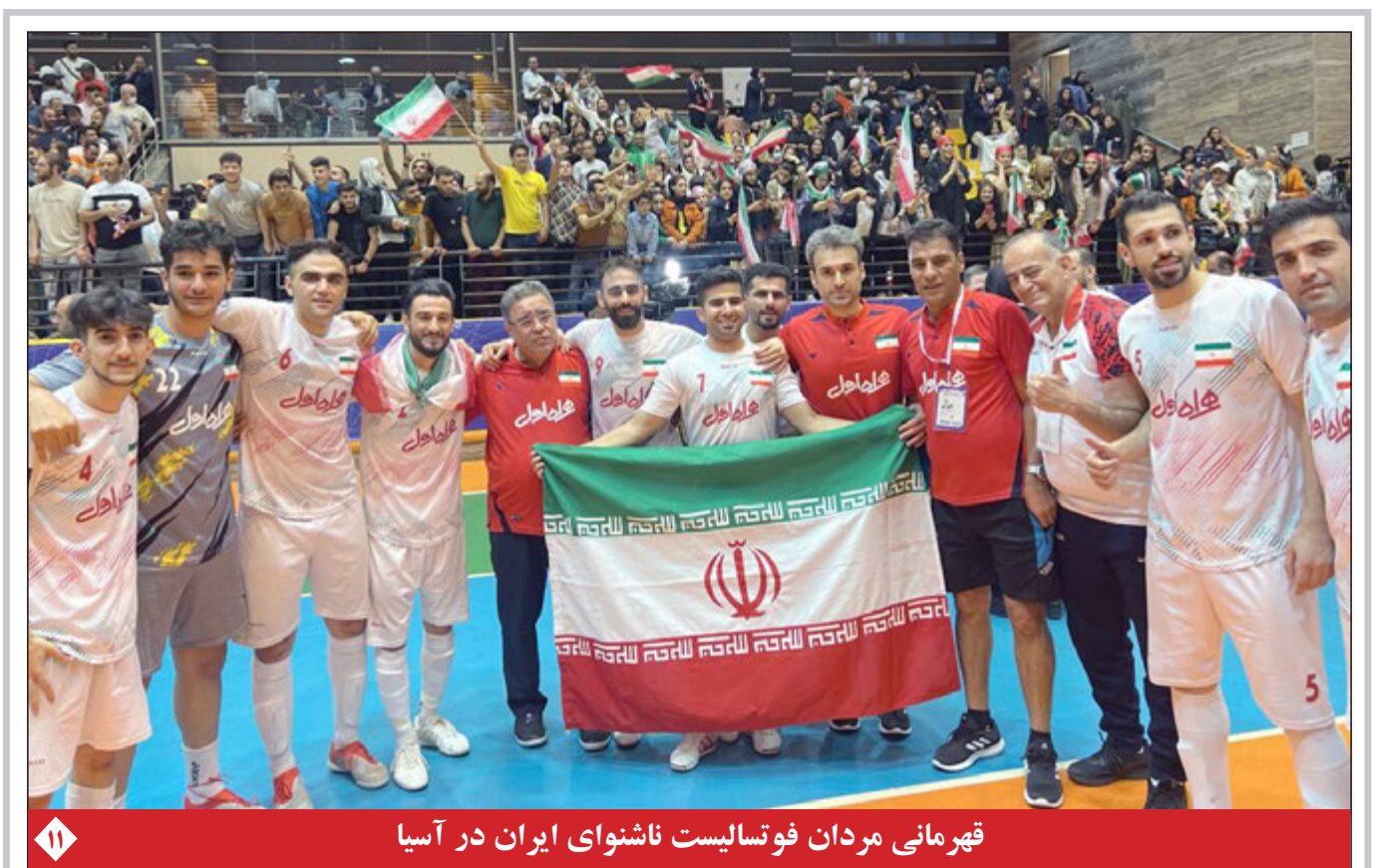
قهرمانی مردان فوتسالست ناشوای ایران در آسیا