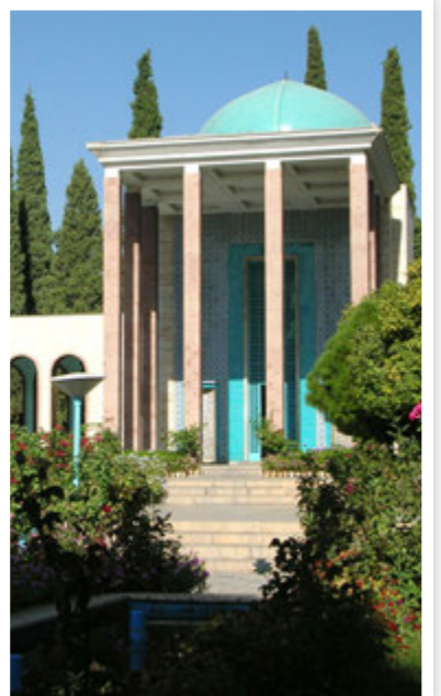
طرح: عصر مردم

شیراز را، شیرازی و رویایی و شهری در خیال است شیراز شهر راز، شهر شور و حال است با شوق بر این شهر رویایی نظر کن شهری که تصویری دل انگیز از خیال است از حیث زیبایی و حُسن این شهر جذاب زیبا شبیه لحظه ناب وصال است برچهره زیبای ایران سرفراز شیراز بایستی بگویم مثل خال است در کورس جذابان و نیکان و تمیزان این شهر الحق، لایق کاپ و مدال است هر شهر دارد آرزو باشد چو شیراز این آرزو از آرزوهای محال است تنها نه در فصل بهاران هست زیبا زیبا و پر لطف و صفا در طول سال است شیراز آن پاکیزه شهر پر طراوت یک انشعاب از جنت زیبا جمال است شیراز شهر شعر و فرهنگ و تمدن شهر گل و بلبل، از این روی بی‌مثال است این شهر، پُر از جلوه‌های بهجت‌انگیز سرسبز در باغ وطن مثل نهال است در دامن ایران زمین بس درخشان پر جاذبه با مردمی صاحب کمال است چون شامل حالش «غمین» لطف خدایی است زین روی برجا ماندنی و بی‌زوال است