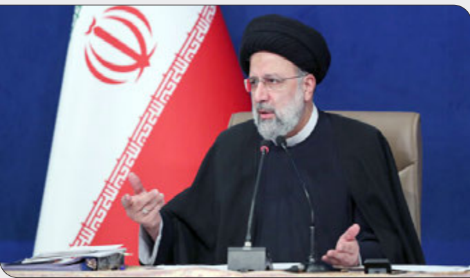
این کنده اجرای طرح ساماندهی بانکهای از کندی اجرای طرح ساماندهی بانکهای مجوز و همچنین اصلاح قانون ارائه مجوز به مشاوریان املاک بر ضرورت تسریع در اجرای

رئیس‌جمهور با انتقاد از تبعیض در تسهیلات‌دهی برخی بانکها تأکید کرد: سازمان‌ها و نهادها موظفند بدون هرگونه اعمال تبعیض میان مردم، امکانات خود را در جهت نفع عمومی بکار بگیرند.