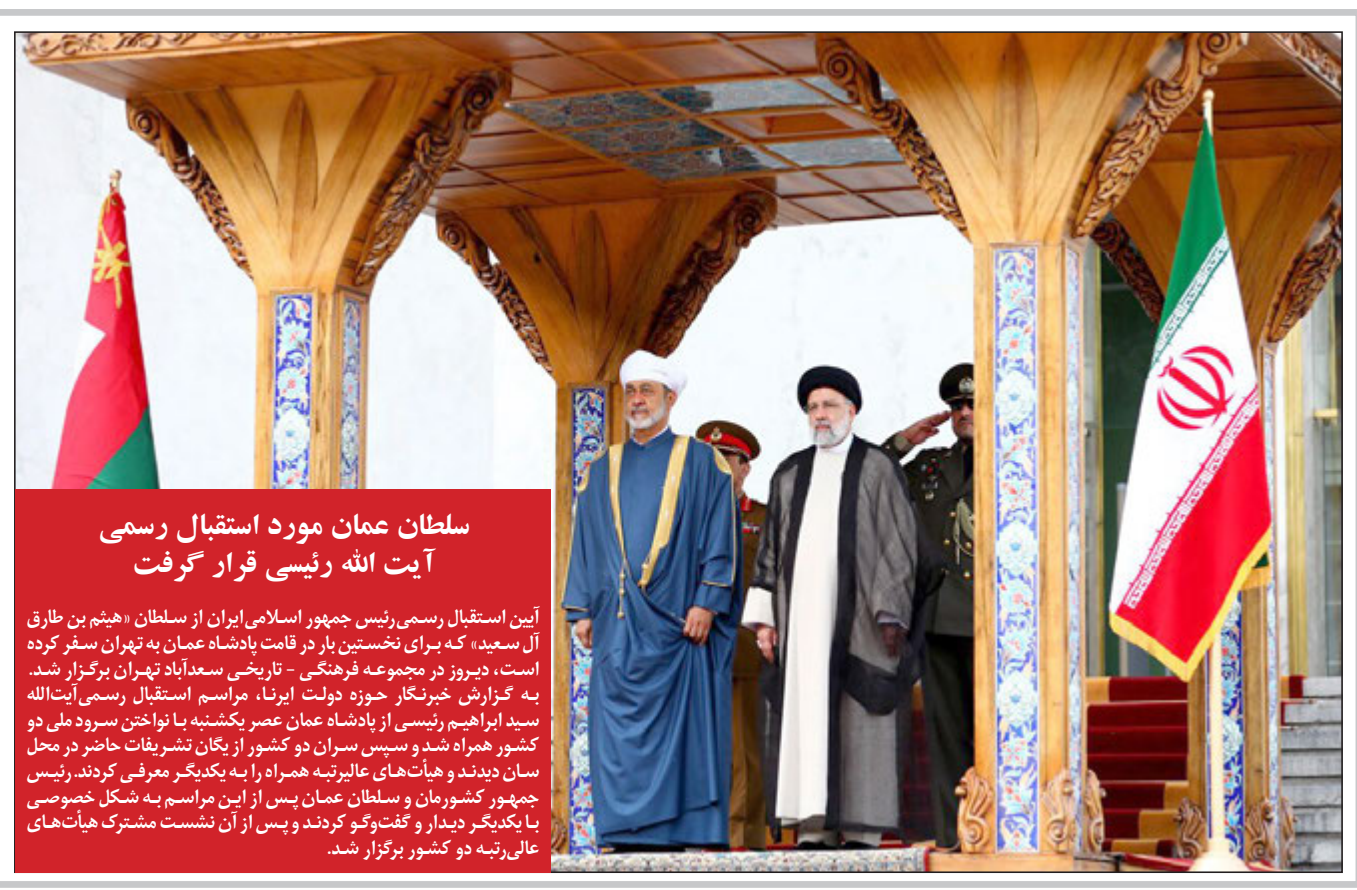
سلطان عمان مورد استقبال رسمی آیت الله رئیسی قرار گرفت این استقبال رسمی رئیس جمهور اسلامی ایران از سلطان «هیثم بن طارق آل سعید» که برای نخستین بار در قامت پادشاه عمان به تهران سفر کرده است، دیروز در مجموعه فرهنگی - تاریخی سعدآباد تهران برگزار شد. به گزارش خبرنگار حوزه دولت ایرنا، مراسم استقبال رسمی آیت الله سعید ابراهیم رئیسی از پادشاه عمان عصر یکشنبه با نواختن سرود ملی دو کشور همراه شد و سپس سران دو کشور از یگان تشریفات حاضر در محل سان دیدند و هیأت‌های عالی‌رتبه همراه را به یکدیگر معرفی کردند. رئیس جمهور کشورمان و سلطان عمان پس از این مراسم به شکل خصوصی با یکدیگر دیدار و گفت‌وگو کردند و پس از آن نشست مشترک هیأت‌های عالی‌رتبه دو کشور برگزار شد.

ثبت جهانی «نظام انجیر استهبان» در مرحله نهایی قرار گرفت با حضور پرفسور لی؛