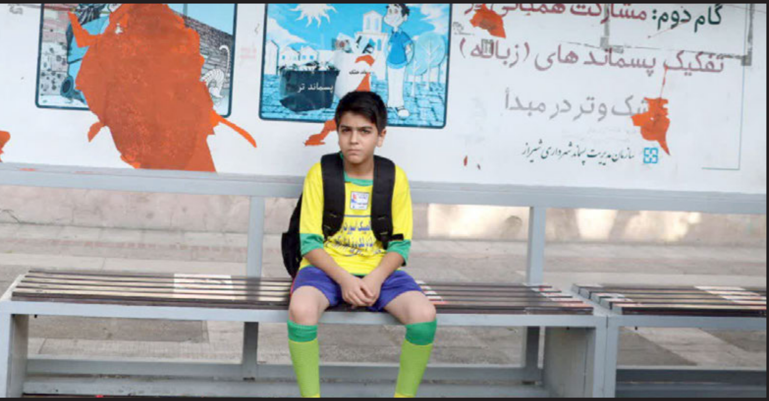
لژوم ساماندهی اوقات فراغت نوجوانان در تابستان