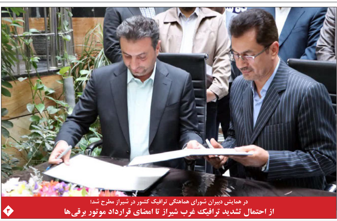
در همایش دبیران شورای هماهنگی ترافیک کشور در شیراز مطرح شد؛ از احتمال تشدید ترافیک غرب شیراز تا امضای قرارداد موتور برقی‌ها