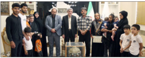
نماینده عالی دولت در فارس در ادامه به قانون جوانی جمعیت و دلایل تصویب آن اشاره کرد و گفت: در تئوین این قانون صرفاً افزایش فرزند ملاک نیست بلکه افزایش فرزند با رویکرد تربیت ایرانی و اسلامی نیز مد نظر است.