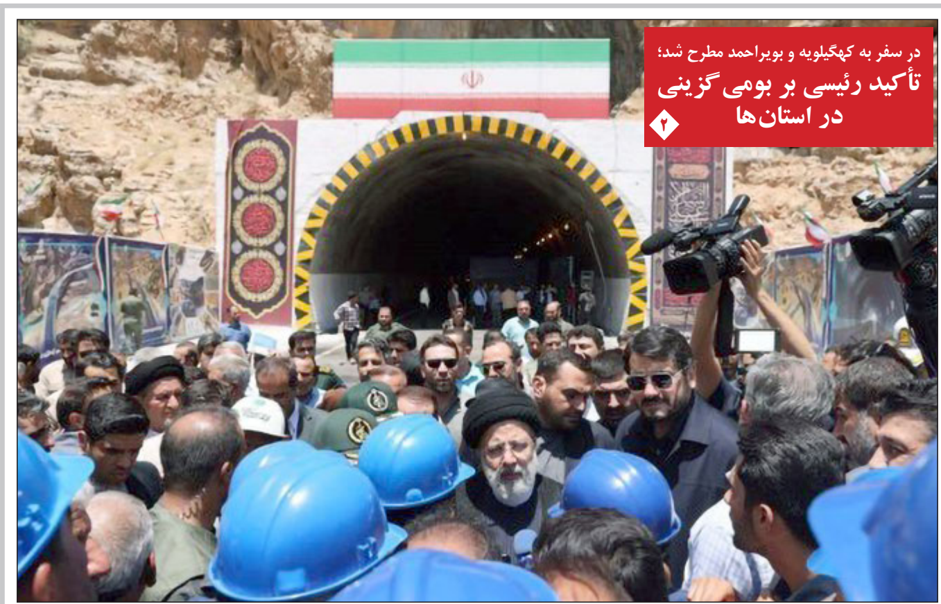
در سفر به کهنگیلویه و بویراحمد مطرح شد: تأکید رئیس بر بومی‌گزینی در استان‌ها