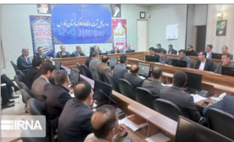
املاک کشور در این زمینه است. معاون قوه قضاییه، کسب ۷۸.۲ درصدی رضایتمندی مراجعان توسط سازمان ثبت را که بیشترین میزان رضایتمندی مراجعه‌کنندگان در بین

رییس قوه قضاییه گفت: قاضی نباید تحت تاثیر فضاسازی‌ها قرار گیرد چرا که در آن صورت عدالتش مخدوش می‌شود. حجت‌الاسلام والمسلمین محسنی اژه‌ای در دیدار قضات و کارکنان قضایی استان فارس با اشاره به حجم بالای کار در دستگاه قضایی، اظهار کرد: حجم کار و سختی کار در دستگاه قضایی بالاست و کمبودها زیاد است، اما باید توجه کنیم که مبادا این سختی‌ها در انگیزه خدمت‌رسانی و اخلاص ما تأثیر بگذارد. رییس دستگاه قضا تصریح کرد: دشمنان طی بیش از ۴ دهه بعد از انقلاب، هر ترفند و خیانتی را به کار بستند تا نظام ما پا نگردد و پیشرفت نکند اما ناکام ماندند. امروز دشمنان اگر می‌توانستند علیه کشور ما اقدام نظامی کنند، درنگ نمی‌کردند اما بواسطه اقتدار ایران اسلامی از پیشبرد این حربه عاجزند. رییس قوه قضاییه تصریح کرد: هیچکس نمی‌تواند