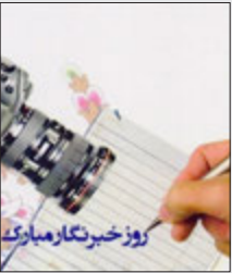
روز خبرنگار مبارک

عصرمردم: در بخشی از بیانیه سپاه فجر به مناسبت روز خبرنگار آمده است: «خبرنگاران قلب تپنده و چشمان همیشه بیدار جامعه هستند که با نشر اخبار و اطلاعات صحیح، زمینه رشد پندارهای مردم را فراهم می‌کنند.» در آستانه فرا رسیدن ۱۷ مرداد، روز خبرنگار، سپاه فجر بیانیه‌ای صادر کرد که متن آن به شرح ذیل آمده است: