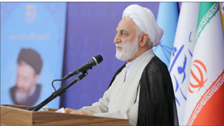
در مقابل اعمال شجاعت قاضی در چارچوب قانون و عدل بایستد؛ قاضی نباید تحت تاثیر فضاسازی‌ها