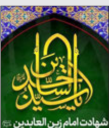
مراسم سالروز شهادت امام زین‌العابدین (ع) در حرم مطهر حضرت شاهچراغ (ع) برگزار خواهد شد.