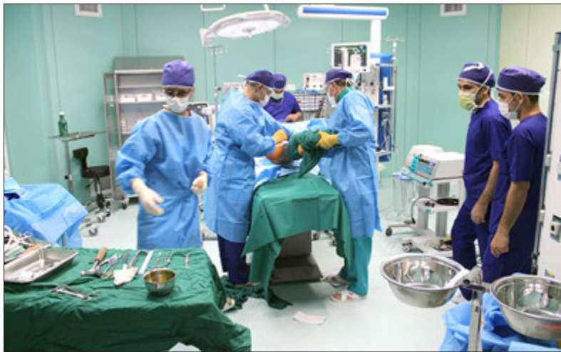
سرپرست تخصصی گروه جراحی فک و صورت در دانشگاه علوم پزشکی شیراز نیز در مورد این عمل جراحی گفت: بیمار پیرمرد ۶۷ ساله که در ناحیه فک بالا دچار تومور همراه با خونریزی‌های شدید از بینی