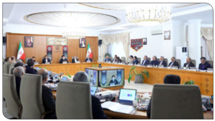
رئیس‌جمهور در بخش دیگری از سخنانش درباره جایگاه و اقتضای بخش حقوقی دولت و دستگاه‌های دیگر در تطبیق دقیق تصمیمات، مصوبات و عملکردها با قانون اظهار داشت: بخش‌های حقوقی دستگاه‌های اجرایی و در رأس آنها معاونت حقوقی ریاست جمهوری موظفند تصمیمات و مصوبات را به دقت با قوانین مربوط تطبیق دهند تا هیچ تناقضی با قانون نداشته باشد. آیت‌الله رئیسی در ادامه به نگاه و انتظار مردم از دولت مردمی در زمینه سلامت اداری اشاره کرد و مبارزه با فساد را اصلی اساسی در دولت سیزدهم دانست و از مسئولان و مدیران دولت خواست که نسبت به وقوع فساد و شکل‌گیری روابط ناسالم، پارتی‌بازی و رشوه حساس باشند و اجازه رخداد هیچ‌گونه مفسده‌ای را ندهند.

رئیس‌جمهور: رئیس‌جمهور در ابتدای این جلسه با پاسداشت سالروز پیروزی رزمندگان حزب‌الله لبنان در جنگ ۳۳ روزه، این پیروزی را ثمره صبر و بصیرت نیروهای مقاومت دانست و اظهار داشت: عملکرد آزادگان سرفراز کشورمان در دفاع مقدس و دوران اسارت، جلوه درخشان دیگری از صبر و بصیرت بود که برای ما درس‌آموز و افتخارآفرین است. آیت‌الله رئیسی همچنین با تسلیت و ابراز همدردی دوباره با خانواده شهدا و مجروحین حادثه تروریستی روز یکشنبه در حرم شاهچراغ (ع) و قدردانی از حضور باشکوه مردم در مراسم تشییع پیکر این شهدا، از اقدام شجاعانه و شرافتمندانه یکی از نیروهای خدوم حرم متبرک حضرت احمد ابن موسی (ع) در مواجهه با فرد تروریست تجلیل کرد. در این جلسه همچنین استاندار سیستان و بلوچستان گزارش مفصلی از روند توسعه و اقدامات انجام شده برای رشد و پیشرفت استان و رفع مشکلات پیش‌روی این روند ارائه کرد.