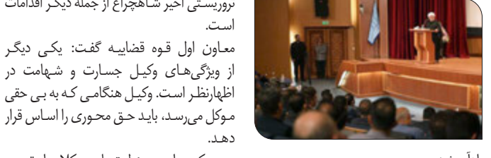
معاون اول قوه قضاییه گفت: جامعه نیازمند وکلایی در تراز انقلاب اسلامی است و همکاری دو نهاد مرکز وکلا و کانون وکلا در جذب و ارائه خدمات وکالتی دوشادوش یکدیگر، برخی تحرکات نفاق‌آمیز را از بین خواهد برد. مصدق در خصوص معیارها و ویژگی‌های یک وکیل در تزار انقلاب گفت: در درجه اول وظیفه یک وکیل دفاع همه‌جانبه از مظلوم و کسی است که قشق ضایع شده است. وی ادامه داد: مسئولیت‌پذیری در ایفای نقش در حوادث پیرامونی جدای از وظایف شخصی و وکالتی که مثال بارز آن اظهارنظر، فعالیت و پیگیری حوادث روز از جمله همین حادثه است.

معاون اول قوه قضاییه: تروریستی اخیر شاهچراغ از جمله دیگر اقدامات است. معاون اول قوه قضاییه گفت: یکی دیگر از ویژگی‌های وکیل جسارت و شهامت در اظهارنظر است. وکیل هنگامی که به بی‌حقی موکل می‌رسد، باید حق محوری را اساس قرار دهد. وی یکی از مسئولیت‌های وکلا را تبیین آزادی‌های مشروع در جامعه و قوه قضاییه دانست و گفت: وکلا هستند که باید منظور از آزادی مشروع را تبیین و سهم قوه قضاییه در گسترش آزادی‌های مشروع را احصا کنند و در این راستا برای احیای حقوق عامه نیز کمک کنند و مطالبه‌گر باشند. وی ادامه داد: اصولاً تعریف حقوق عامه باید روشن شود و وظیفه‌ی مدعی العموم در این خصوص مشخص شود. معاون اول قوه قضاییه گفت: وکلا برای شناخت مفسدين اقتصادی و به خصوص شناسایی دانه درشت‌ها باید به دستگاه قضایی کمک کنند که این رسالت‌های یک وکیل در تزار انقلاب است.