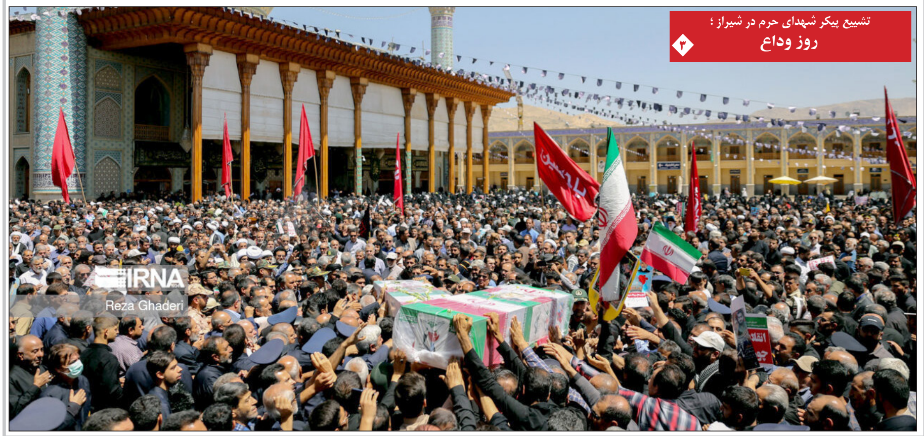
تشییع پیکر شهدای حرم در شیراز؛ روز وداع

نماینده شیراز: ۲ روز است که بنزین در شیراز به اندازه کافی عرضه نمی‌شود نماینده شیراز در توییتی اعلام کرد که دو روز است در شیراز بنزین وجود ندارد. روح اله نجات نماینده مجلس در توییتی نوشت: جهت اطلاع وزیر محترم نفت! اگر گزارش خطا به جنابمالی داده اند در همکاران خود تجدید نظر فرمایید. چرا که بعید می‌دانم اطلاع داشته باشید اما به خطا گزارش به مردم بدهید. در شیراز ۲ روز است که بنزین کافی عرضه نمی‌شود و جایگاه‌های بنزین در ساعات پایانی روز عرضه سوخت به مردم ندارند.