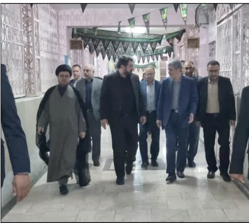
از اماکن اندرگاهی و خدماتی در زندان عادل آباد شیراز و بازدیداشتگاه مرکزی شیراز نیز تا حصول نتیجه مساعدت لازم به عمل خواهد آمد.

استاندار فارس با اشاره به قدمت و فرسودگی بخشی از اماکن زندان عادل‌آباد شیراز، بر ضرورت نوسازی، بازسازی و بهسازی آن تأکید کرد. محمدهادی ایمانیه در حاشیه بازدید از بخش‌های مختلف زندان عادل‌آباد و بازدیداشتگاه مرکزی شیراز بیان کرد: زندان عادل‌آباد شیراز افزون بر ۶۰ سال قدمت دارد و بخش‌هایی از آن به مرور فرسوده شده است، از دیگر سو زندان در بافت مسکونی و شهری قرار گرفته که بر اساس برنامه توسعه کشور، انتقال زندان‌ها از بافت مسکونی به بیرون از شهرها از تکالیف مهم به شمار می‌آید، از این رو بنده و این هیئت موضوع تأمین زمین مناسب برای ساخت زندان جدید و انتقال آن به خارج از شهر را بصورت جدی در دستور کار قرار داده و به زودی طی جلسه‌ای در حضور وزیر مسکن و شهرسازی، آن را پیگیری خواهیم کرد. به نقل از روابط عمومی اداره کل زندان‌های فارس، او همچنین با اشاره به قدمت و فرسودگی بخشی از اماکن زندان بر ضرورت نوسازی، بازسازی و بهسازی آن تأکید کرد و گفت: همانطور که در اسلام و قانون برای زندانیان حق و حقوقی تعیین شده و تأمین مکان مناسب نگهداری، طبقه‌بندی زندانیان و آموزش و توانمندسازی آنان از جمله این حقوق محسوب می‌شود، نسبت به تأمین اعتبارات لازم برای بازسازی برخی