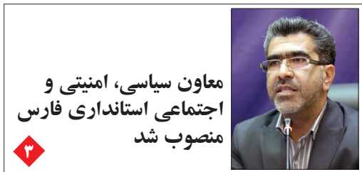
معاون سیاسی، امنیتی و اجتماعی استانداری فارس منصوب شد