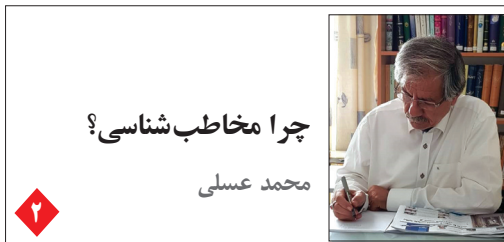
چرا مخاطب شناسی؟ محمد عسلی

رئیس جمهوری در گفت و گو با خبرنگاران تأکید کرد: