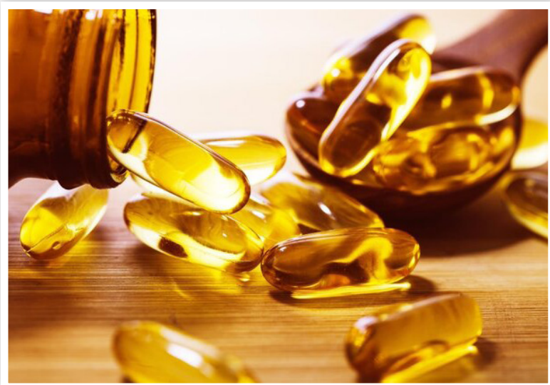
افسردگی را مورد بررسی قرار داده است در این مورد اظهار کرد که با وجود پیشرفت قابل توجه

در علوم اعصاب در دو دهه گذشته، همچنان درمان افسردگی دشوار است. وی گفت: بسیاری از این درمان‌ها به اندازه کافی مورد ارزیابی قرار نگرفتند به همین دلیل ارزیابی اثربخشی امگا ۳، به‌عنوان یکی از محبوب‌ترین رویکردهای جایگزین، مهم است.