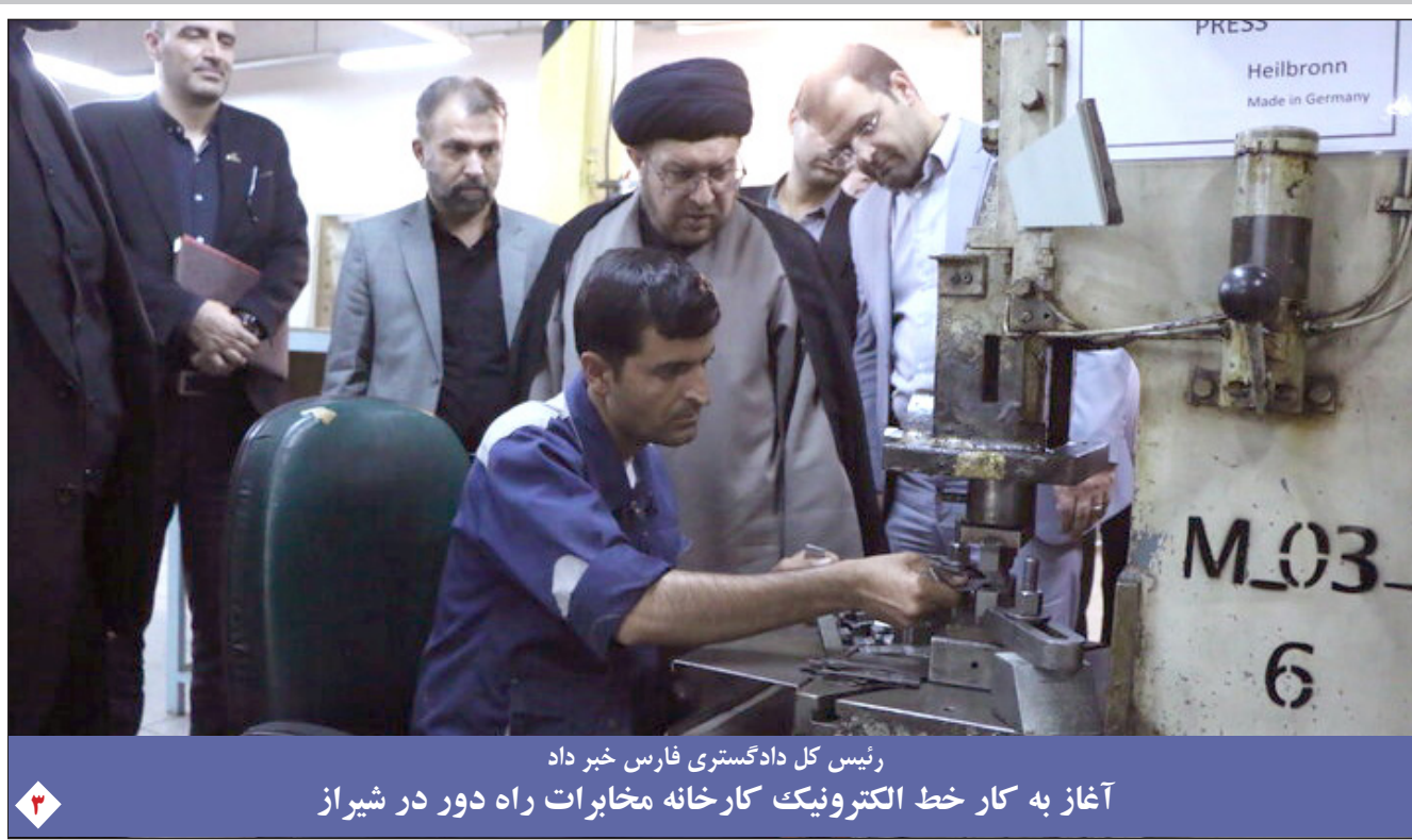
رئیس کل دادگستری فارس خبر داد