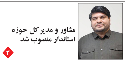
مشاور و مدیر کل حوزه استاندار منصوب شد