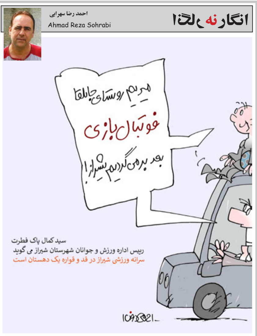
سید کمال پاک فطرت رئیس اداره ورزش و جوانان شهرستان شیراز می‌گوید سرانه ورزشی شیراز در قد و قواره یک دهستان است