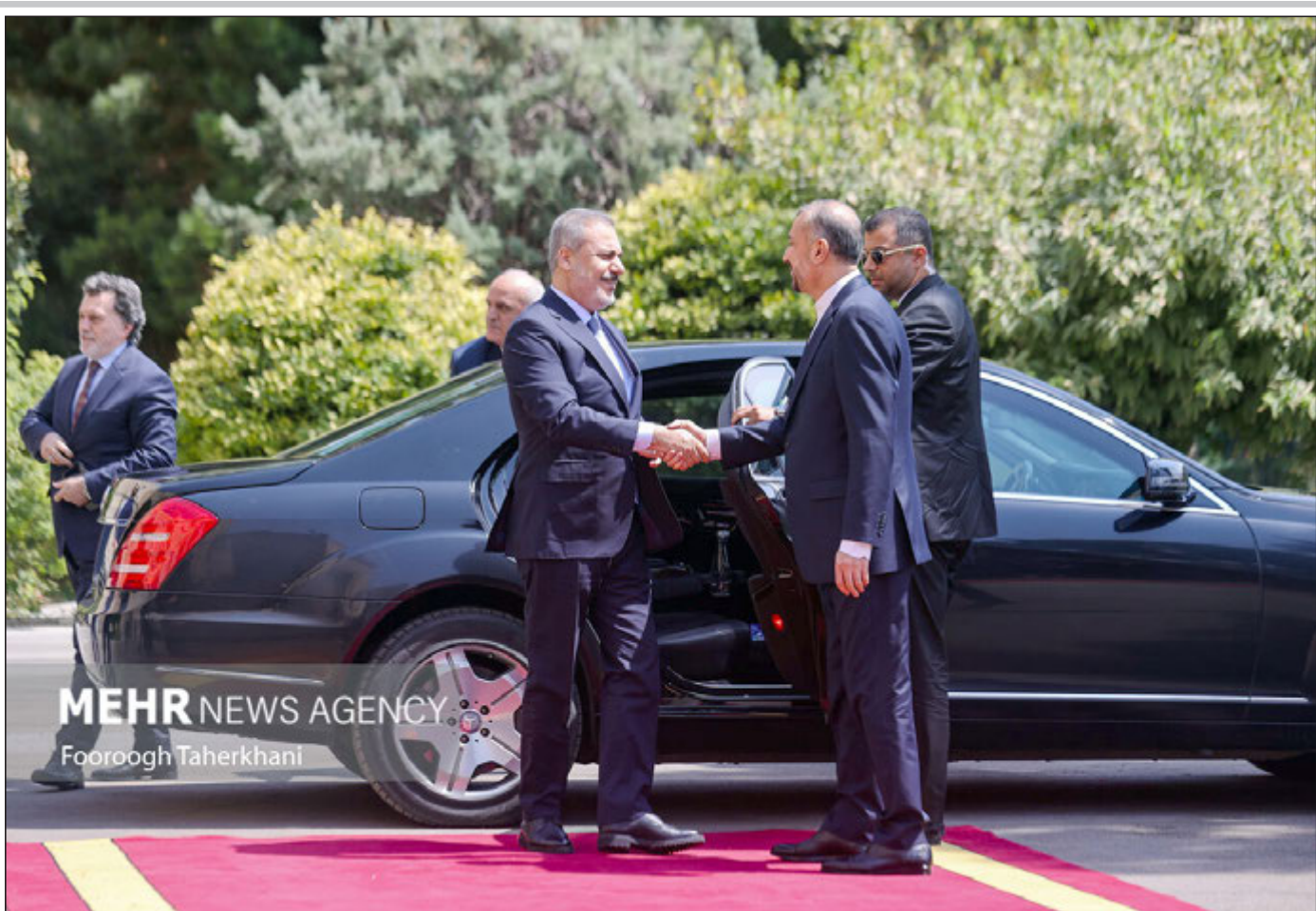
MEHR NEWS AGENCY Foorooogh Taherkhani

وزیر امور خارجه ترکیه در سفر به تهران اعلام کرد: آماده میزبانی از رئیس جمهوری ایران هستیم وزیر خارجه ترکیه گفت: در چارچوب هشتمین نشست شورای عالی ایران و ترکیه پذیرای رئیس جمهور ایران خواهیم بود. به گزارش خبرنگار سیاست خارجی ایرنا، هاگان فیدان وزیر امور خارجه ترکیه روز یکشنبه در نشست خبری مشترک با همتای ایرانی خود گفت: امروز به عنوان وزیر خارجه ترکیه اولین بار به ایران سفر می‌کنم. از وزیر امور خارجه ایران به دلیل میهمان نوازی‌اش تشکر می‌کنم. بین ایران و ترکیه پیوندهای تاریخی وجود دارد. وی تصریح کرد: دو کشور در کمال صلح زندگی می‌کنند. در زلزله ترکیه ما همبستگی خود را مجدداً نشان دادیم و از ایران تشکر می‌کنیم. تحولات و بحران‌های اجتماعی بر اهمیت روابط ما می‌افزاید. وزیر خارجه ترکیه افزود: در چارچوب هشتمین نشست شورای عالی ایران و ترکیه در روزهای آتی پذیرای آقای رئیسی در آنکارا خواهیم بود. فیدان بیان کرد: امنیت مرزهای مشترک، مبارزه با تروریسم، حمل و نقل و غیره را مورد تبادل نظر قرار دادیم و در خصوص تروریسم حساسیت‌های خود را مطرح کردیم. وزیر خارجه ترکیه تصریح کرد: همچنین در خصوص گام‌ها برای افزایش حجم تجارت گفتگو کردیم. در تجارت مرزی کشاورزی حمل و نقل موقعیت کشورهای خودمان را مطرح کردیم. در دیدار خود در خصوص همکاری‌ها در موضوع انرژی نیز گفتگو کردیم و امیدوارم که مسائل را از طریق درک مشترک حل کنیم.