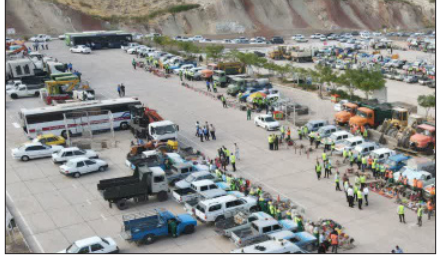
مانور مشترک آمادگی زمستانه در شیراز