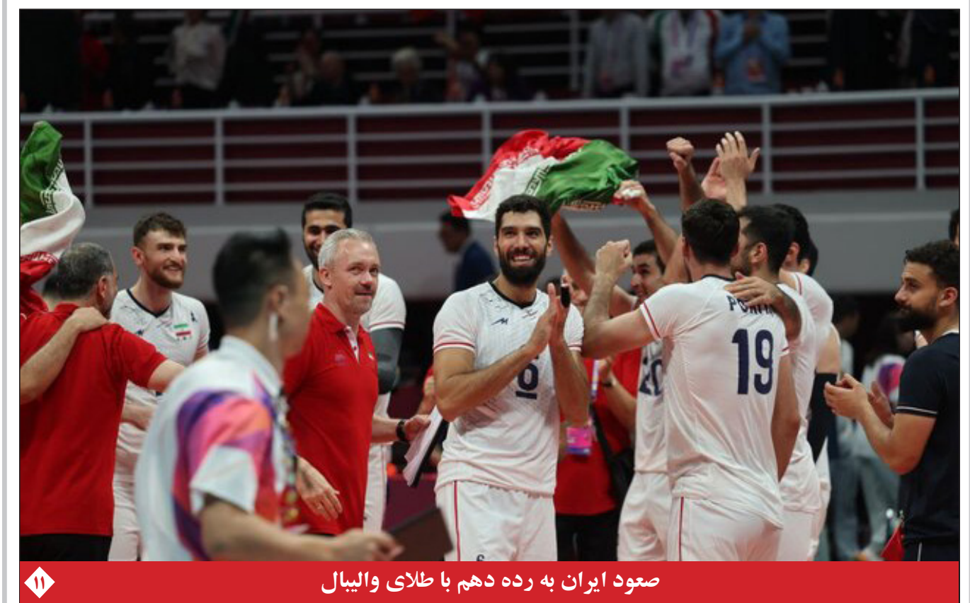
صعود ایران به رده دهم با طلای والیبال

نماینده چابهار در مجلس شورای اسلامی گفت: دادن سیمکارت بدون فیلتر به گردشگر خارجی به نوعی توهین به شأن ملت ایران از نگاه بنده است، معتمد رئیس‌جمهور به عنوان حافظ قانون اساسی باید به جبران رفع محدودیت‌ها برآید. کسانی که محدودیت‌های اینترنتی ایجاد می‌کنند، خودشان دسترسی نامحدود به همه پلتفرم‌های فضای مجازی دارند. معتمدین‌الدین سعیدی در گفت‌وگو با خبرنگار ایلنا، درباره تصویب طرح سیمکارت بدون فیلتر برای گردشگران خارجی گفت: زمانی که این موضوع مطرح شد نسبت به پیامدهای اجتماعی‌اش هشدار دادم در حال حاضر هم در کارگروه رفع مصادیق مجرمانه تصویب شده است، این یک توهین آشکار به ملت ایران است. مردم کشور ما از نظر آقاییان به این بلوغ نرسیدند که بتوانند از اینترنت بدون فیلتر استفاده کنند اما برای گردشگری که به کشورمان می‌آید این را حق طبیعی او می‌دانند که بتوانند از اینترنت بدون فیلتر استفاده کنند. نماینده چابهار در مجلس شورای اسلامی تأکید کرد: کسانی که چنین محدودیت‌هایی را ایجاد کرده‌اند خودشان خوب می‌دانند که اجرائی نیست و مردم از طریق فیلترشکن همه این محدودیت‌ها را با شرایط سخت‌تر عملاً دور می‌زنند. وی خاطرنشان کرد: جالب اینجا است کسانی که چنین محدودیت‌هایی ایجاد می‌کنند، خودشان دسترسی کامل به همه پلتفرم‌های فضای مجازی بدون هیچ محدودیتی دارند.