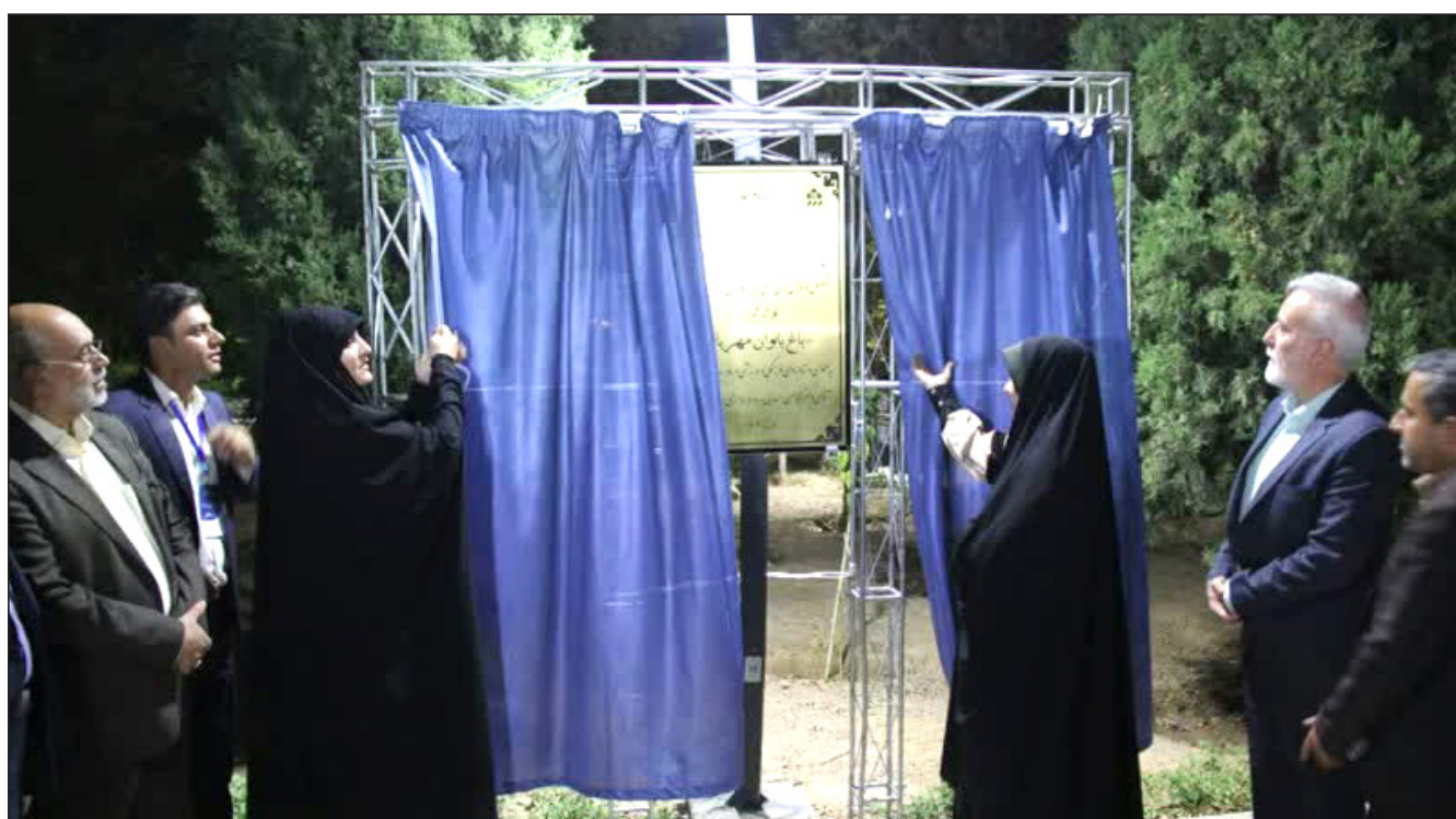
در آیین افتتاح دومین باغ بانوان مهربانو در شیراز مطرح شد؛ باغ بانوان می تواند به الگویی در کشور تبدیل شود

نوید شهردار منطقه ۵ شیراز در آیین جشن میلاد "پیامبر مهربانی" به شهروندان: