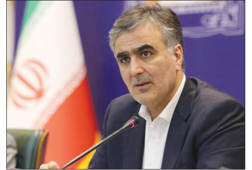
رئیس کل بانک مرکزی با اشاره به موفقیت‌های دولت ایران در کنترل مهار تورم و رشد اقتصادی در شش ماه گذشته گفت: دولت

و بانک مرکزی به اجرای سیاست‌های تثبیت اقتصادی برای کنترل تورم و تحقق رشد اقتصادی پایبند است. به گزارش ایسنا، محمدرضا فرزین در جلسه رؤسای کل بانک مرکزی و وزرای منطقه خاورمیانه و آسیای مرکزی صندوق بین‌المللی پول (IMF) که دیروز در مراکش با سخنرانی گئورگیوا - مدیرعامل صندوق بین‌المللی پول - برگزار شد، گفت: اقتصاد ایران پس از تحمل تکان‌های مختلف، هم اکنون به پایداری لازم دست یافته است. فرزین تصریح کرد: دولت و بانک مرکزی در واکنش به تکان‌های بیرونی، بسته سیاستی شامل مجموعه‌ای از سیاست‌های متوازن به منظور تثبیت اقتصادی را طراحی و عملیاتی کرده است. رئیس کل بانک مرکزی در ادامه این اجلاس گفت: بر این اساس، نرخ رشد در دو فصل اول سال ۲۰۲۳ به طور متوسط به ۵.۸ درصد و