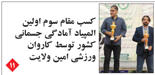
کسب مقام سوم اولین المپیاد آمادگی جسمانی کشور توسط کاروان ورزشی امین ولایت