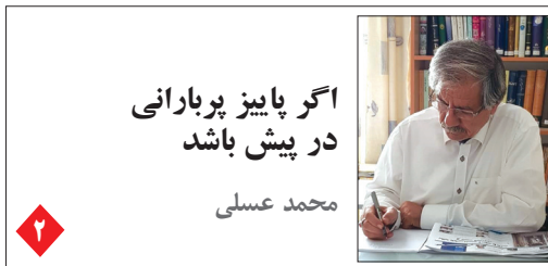
اگر پاییز پر بارانی در پیش باشد