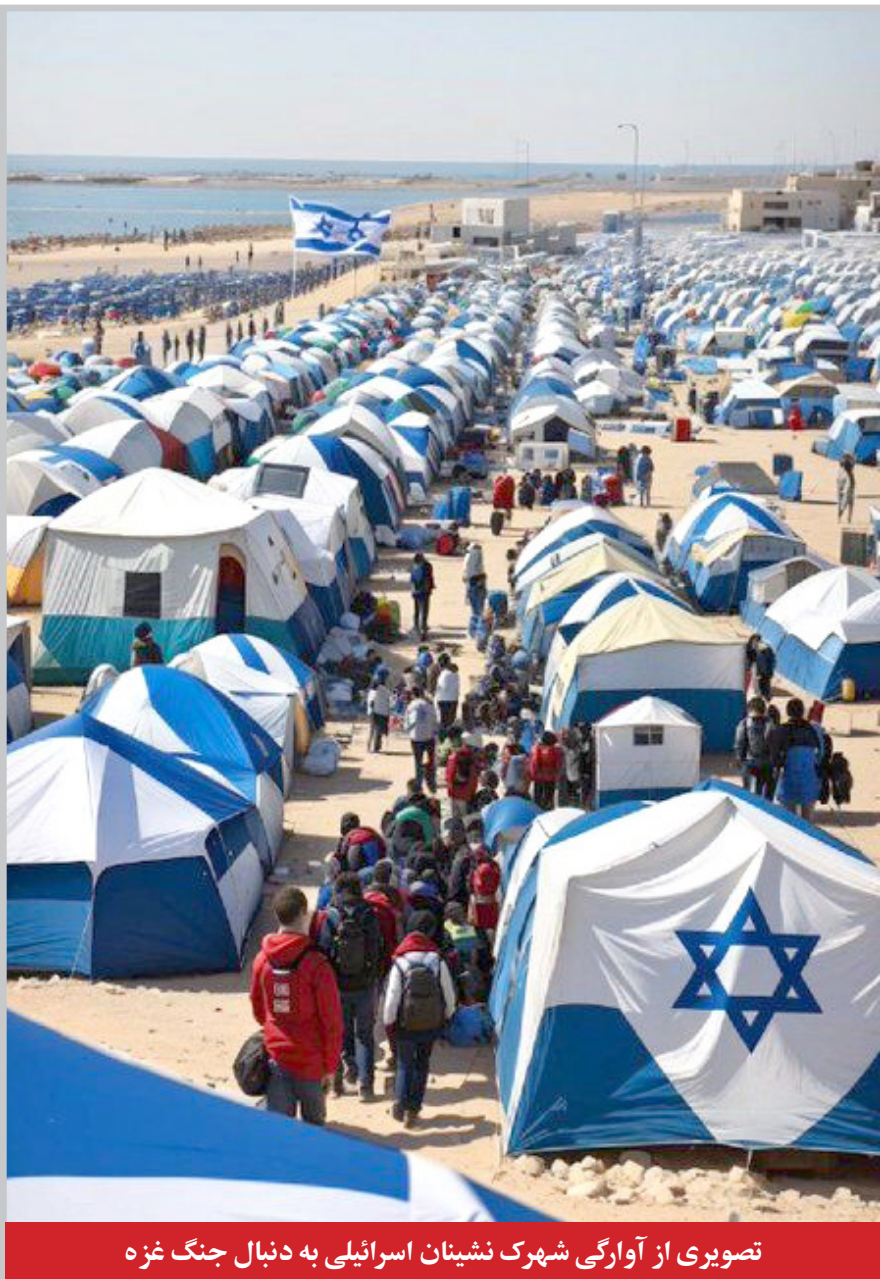
تصویری از آوارگی شهک نشینان اسرائیلی به دنبال جنگ غزه

دیدار وزیر همکاری های بین المللی آفریقای جنوبی با رئیس جمهور رئیس: دیگر امیدی به نقش آفرینی شوری امنیت سازمان ملل در حفظ صلح جهانی نیست