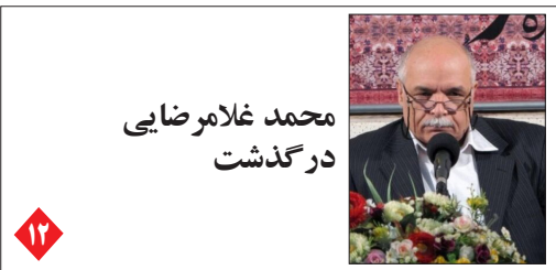
محمد غلامرضایی درگذشت